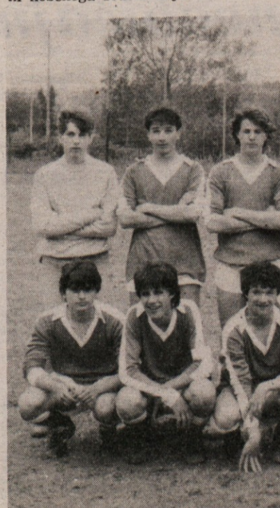
Pri okrogli mizi o nogometu je bila skoraj skupna ugotovitev, da brez združevanja sil ne moremo pričakovati boljših uspehov slovenskih nogometnih ekip. Konkreten primer združevanja na mladinskem področju je ekipa naraščajnikov ZSSDI Gorica, ki je skupno nastopala že v prvenstvu naraščajnikov na Goriškem

si predstavljati, da bi lahko povprašali eno ali drugo ekipo po enem igralcu, da bi si lahko tako opomogli, ker med nami vlada samo kampanlizem, ne pa športno vzdušje. Dokler bo trajala ta mentaliteta, ne bo nobene rešitve za naše ekipe.«