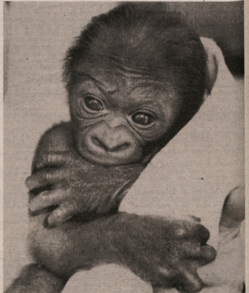
Tudi gorile se rojevajo v epruveti. Zgodilo se je v Melbournu in to je drugi primer umetne zaploditve. Sicer pa se mali gorila dobro počuti