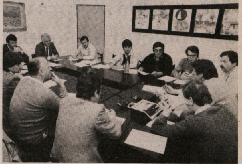
Udeleženci naše okrogle mize o nogometni problematiki