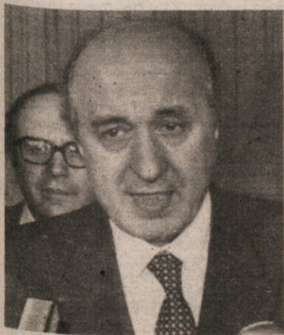
Ciriaco De Mita

V avli senata začetek razprave o vladnem protiinflacijskem odloku