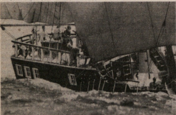
Britanska jadrnica Marques po startu na regati kopij starih jadrnic od Bermudov do Halifaxa