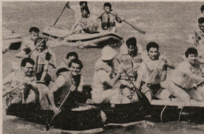
»Že ker reka umira, plujemo po njej v trugah.« Tako je dejala posadka »Katabarana I.«, da bi opozorila na onesnaženje v reki Tronto.