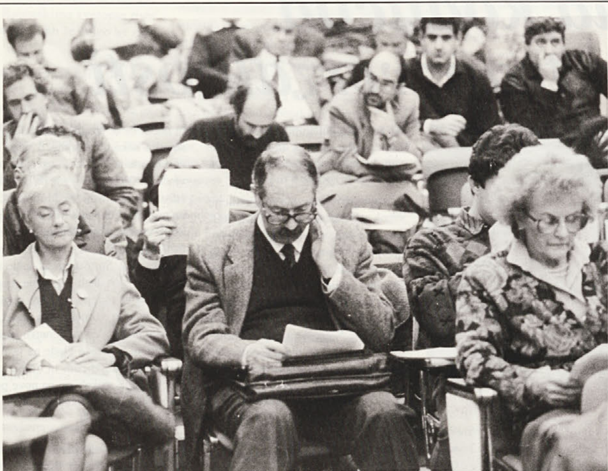
18. in 19. novembra je tržaška federacija DSL priredila Organizacijsko konferenco, na kateri so bili poleg organizacijskih, v razpravi tudi politični aspekti delovanja stranke v Trstu. Na koncu je bil odobren dokument, ki ga objavljamo na drugem mestu.