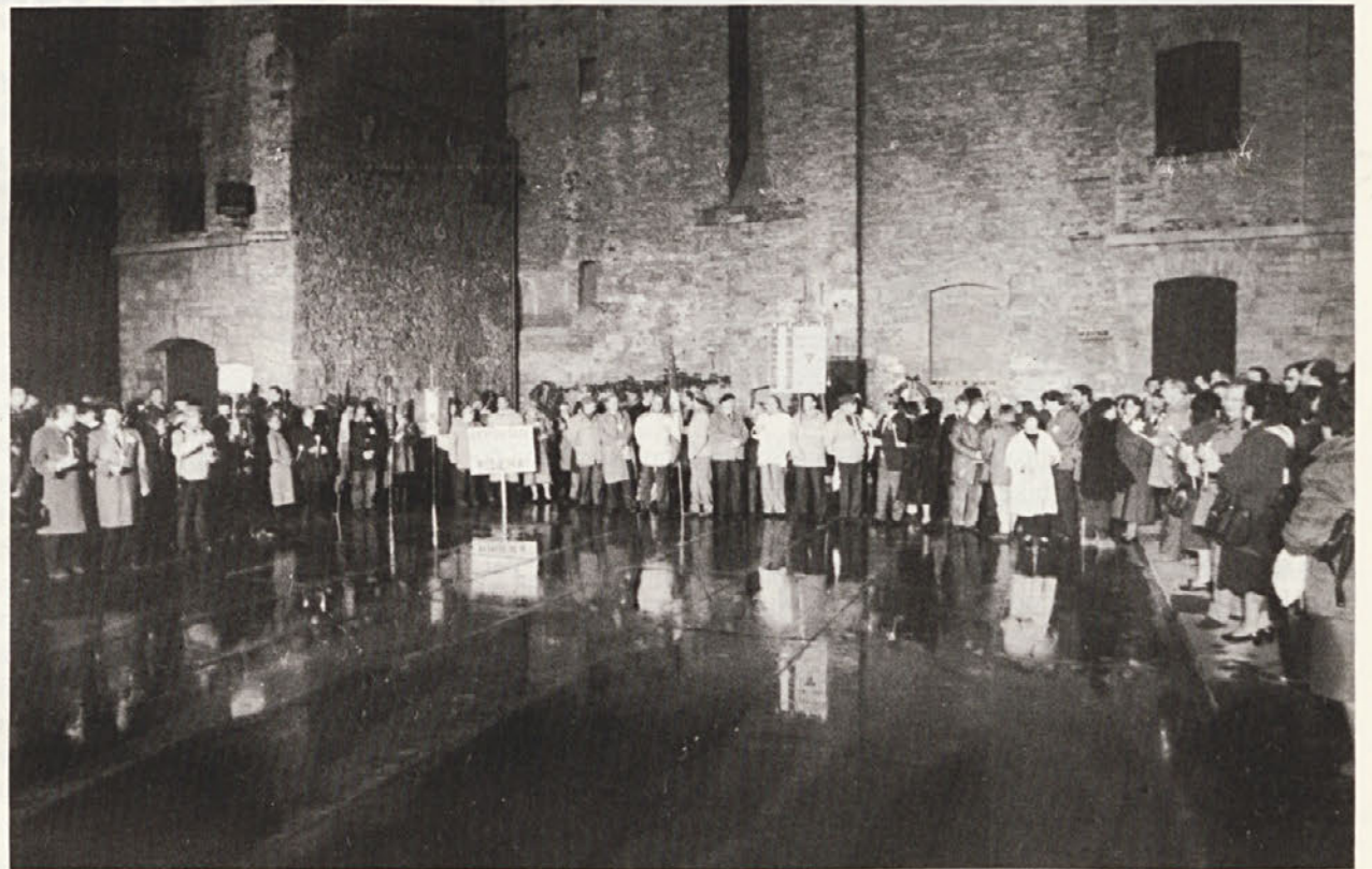
Pretekli petek, 27. in soboto, 28. novembra je vsedrjavni TG 3 oddajal poročila neposredno iz tržaške Rižarne, da bi tako prispeval k budnosti in mobilizaciji proti naraščajočim pojavom antisemitizma in nasploh rasističnega divjanja po Evropi. V soboto je bila ob tej priložnosti v Rižarni protirasistična manifestacija. (na sliki)

To pomeni, da se morajo tako vlade kot politične sile in drugi aktivni dejavniki na eni in drugi strani meje potruditi za to, da se v javnosti vko-reninita spoznanje in zavest, da so manjšine važen faktor za utrjevanje prijateljskih odnosov in odnosov čim tesnejšega sodelovanja med narodi in državami. Zaradi tega so manjšinske skupnosti vredne vsega spoštovanja in zaščite, ne pa špekulacij, diskriminacij in natolcevanj.