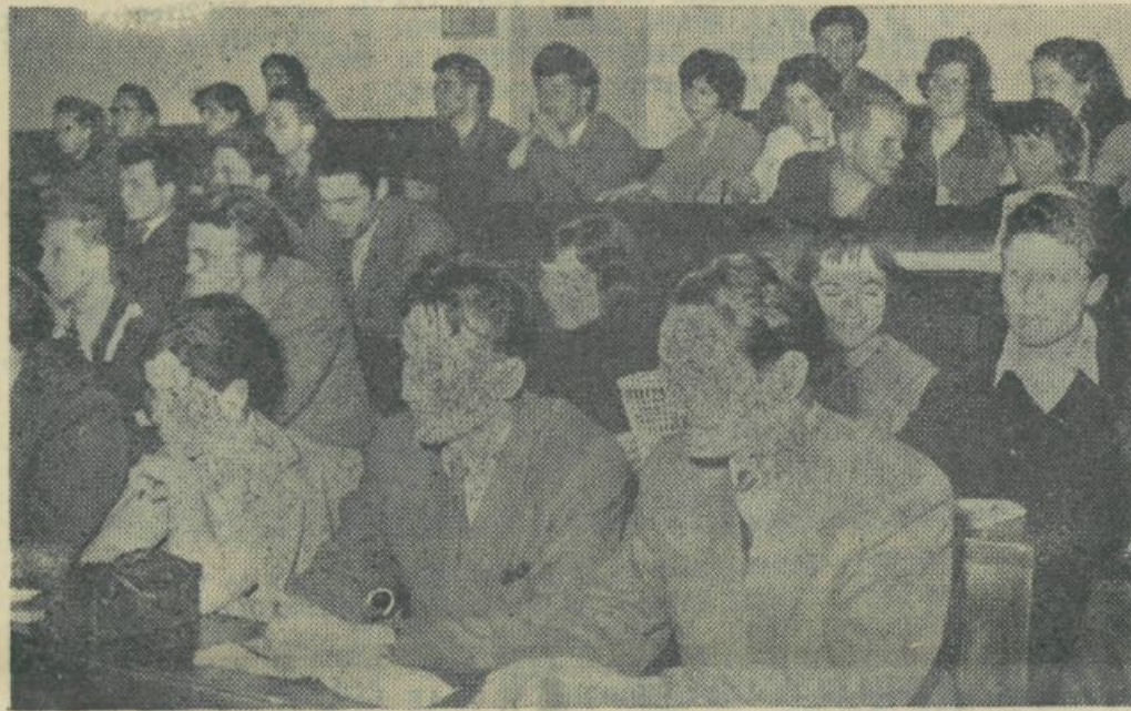
Spremembe v oblikah delovanja Zveze študentov na filozofski fakulteti. Študentje pozorno spremljajo potek svoje skupščine

Predstavniki UO ZSJ je v svojem pozdravu skupščini nakazal nekaj smernic za delo novega odbora. Poudaril je pomen Zveze študentov kot politične organizacije, kjer ne sme biti študijska problematika na prvem mestu zanimanja, ampak je predvsem treba skrbeti za ideološko izobraževanje študentov in vzbuhati v njih zanimanje za sodobna družbena vprašanja.