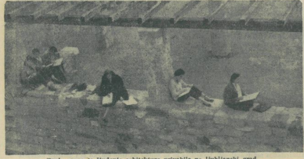
Toplo sonce je študente arhitekture privabilo na ljubljanski grad.