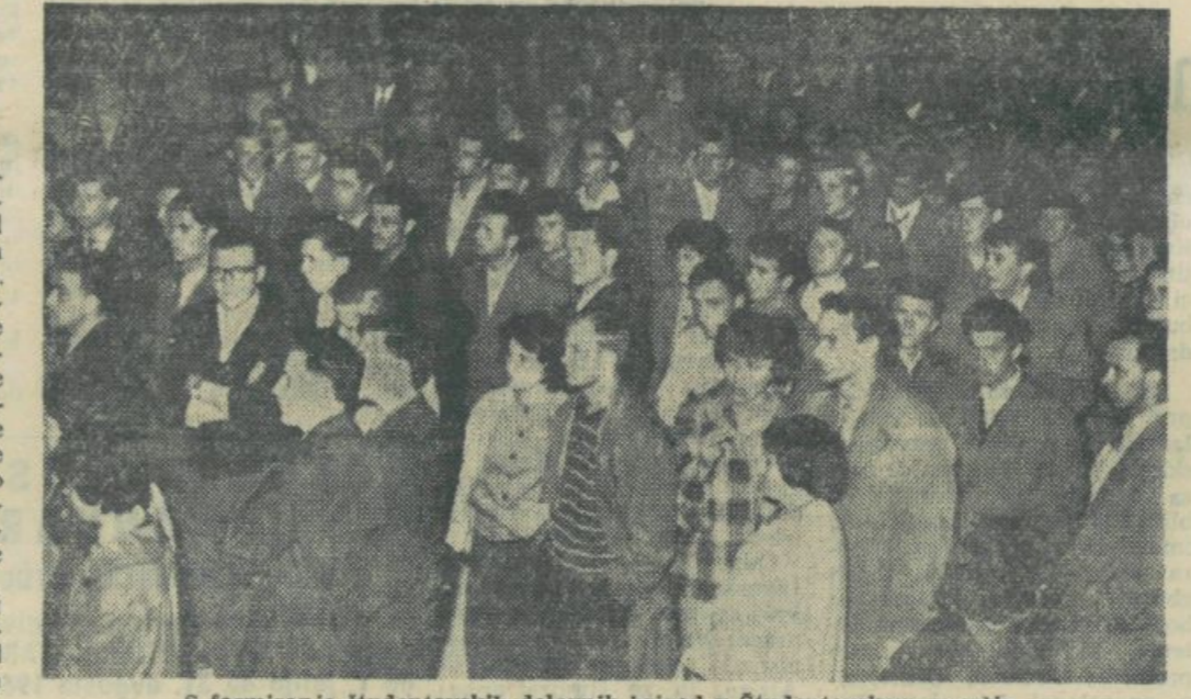
S formiranja študentovskih delovnih brigad v študentovskem naselju.

Ce ga ne bi imel pred seboj živega in vsega zamakajenku v pripovedovanje bi bil prepričan, da je to njegova življenjska zgodba.