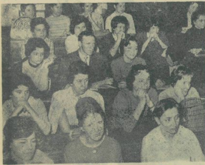
S skupščine agronomov.

To leto je bilo tudi leto mrazilnega pripravljavanja študijskih načrtov za nov etapni študij. Največ nalog v zvezi z reševanjem tekočih študijskih problemov so prevzeli sveti letnik.