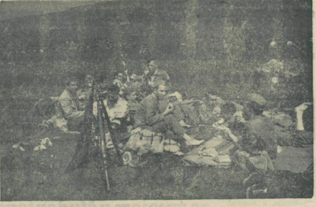
III. PARTIZANSKI MARŠ ŠTUDENTOV PRAVA

njih šol ne namerava nadaljevati študija, pa so predvsem pomanjkanje sredstev, želja po ekonomski samostojnosti, želja, da pridejo čim prej do poklica mnogi smatrajo, da jih bo študij preveč obremenjal itd. Pričakujemo, da se bo večina tistih, ki iz srednjih šol nameravajo nadaljevati študij, v jeseni tudi vpisala, ker ne bo več numerus clausus. Poleg teh pa se bodo vpisali tudi tisti, ki iz prakse, ki bodo opravili dopolnilni izpit. Vsako leto se vpiše tudi večje število študentov iz drugih republik, tako da ne moremo točno predvideti, koliko študentov bodo imele univerze, akademija in višje šole v zimskem semestru 1960-61.