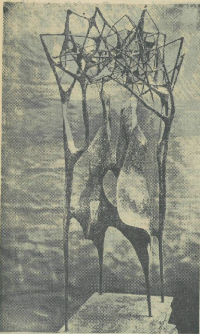
Minguzzi Luciano: Senec v gradu

Nekaj misli ob petem kongresu jugoslovanskih likovnih umetnikov