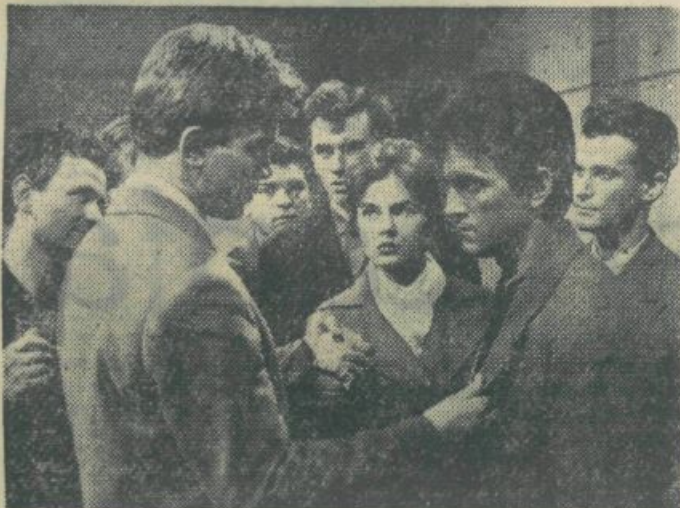
V »Devetem krogu« nastopa vrsta mladih igralcev, nekateri prvič pred filmsko kamero