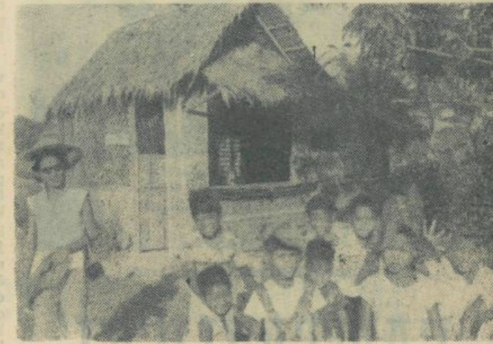
...e so osnovne šole na Filipinih

Podobne so bile razmere in podobno usodo so doživljali študentje v Vietnamu. Prostor nam ne dopušča, da bi podrobneje opisovali, kaj vse so doživljali študentje v ostalih jugovzhodnih deželah Azije, vendar nam je usoda indonezijskih in vietnamskih študentov pove dovolj.