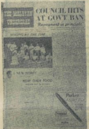
Na strani znanega azijskega študentskega časopisa Malayan Undergrad. Ukvarja se predvsem z domačimi zadevami.

Kot posebno črto študentskega življenja v Aziji moramo omeniti še udeležbo dijakov in včasih celo ljudskošolskih učencev v nacionalnem študentskem gibanju ali celo v politiki. To še posebno velja za Burmo, Malajo in Indonezijo. To je še posebno čudno za Evropejce in Američane, kjer je razlika med študenti in srednješolski precej ostra. Razlog je zelo enostaven, povprečna starost srednješolca je v azijskih deželah znatno višja od naše, to pa še posebno velja za njihove voditelje, ki so navadno univerzitetni študentje. Drago Čiči