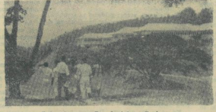
Del univerze v Paradeniyi na Ceylonu

služili svojemu narodu, temveč maloštevilno domačinsko elito, ki bi jo lahko koristno uporabili v gospodarstvu na nižjih administrativnih položajih. To se je odražalo tudi v učnih načrtih, ki so bili pretežno usmerjeni na učenje jezika metropol. Možnosti za doseg naslova inženirja, socialnih in zdravstvenih delavcev pa so bile izredno omejene, čeprav so bile potrebe po