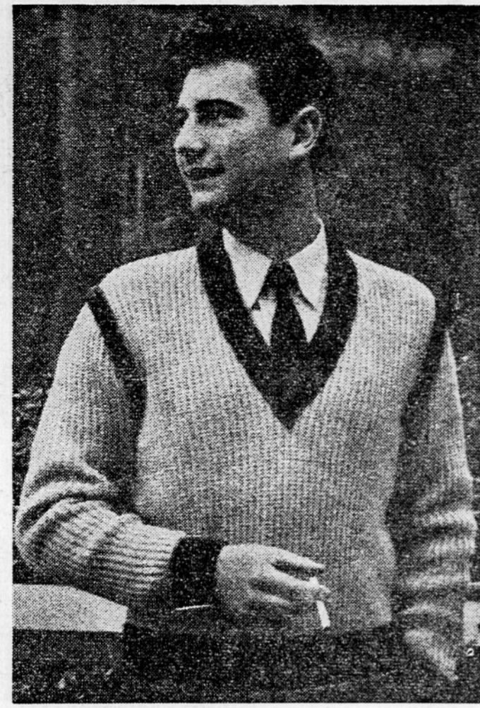
Ta možki športni pulover z drugobarvnimi robovi je praktičen in tople. Z njim lahko razveselite svojega moža ali prijatelja.

Med vzgojnimi problemi je večkrat, mnogo takih, za katere prav nič ne vemo, kako bi jih rešili. Danes bi govorili o nekaterih, ki so skoraj na dnevnem redu v odnosih med starši in otroki. Med vzgojnimi problemi je večkrat, mnogo takih, za katere prav nič ne vemo, kako bi jih rešili. Danes bi govorili o nekaterih, ki so skoraj na dnevnem redu v odnosih med starši in otroki. Med vzgojnimi problemi je večkrat, mnogo takih, za katere prav nič ne vemo, kako bi jih rešili. Danes bi govorili o nekaterih, ki so skoraj na dnevnem redu v odnosih med starši in otroki.