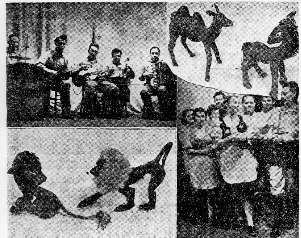
Slika prikazuje orkester in folklorno skupino bolnišnice za duševne bolezni v Polju in izdelke umetne obrti, dela bolnikov

bolniki in mu gre za njegovo poštrevnost in uspešno delo res vse priznanje. Bolnišnica v Polju je za namene psihoterapije uredila tudi obsežno ekonomijo, na kateri bolniki na svežem zraku in pri fizičnem delu črpa moč in zdravje. Pri tem je vredno omeniti, da je kolektivna delovna terapija na tej ekonomiji beležila v 1948. letu 31.400 delovnih ur, 1949. leta 40.643 ur, lani pa kar 60 tisoč delovnih ur. To so le drobci, ki nas seznanjajo z resničnim življenjem bolnišnice v Polju. Ve pa še vrsta drugih stvari, o katerih bi se dalo pisati in ki bi potrdile poštrevnost in skrb naših psihiatrov do tistih bolnikov, ki jih jim je zaupala družba z namenom, da se vrnejo med njo zdravi in za delo sposobni.