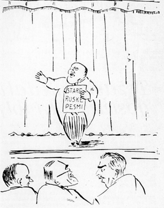
Razočaran avditorij

Haag, 5. feb. (AFP). Predsednik grške vlade maršal Aleksander Papagos je s svojim spremstvom davi odpotoval iz Haaga v Pariz. Na obisku v Holandiji je bil od 2. februarja in se sedaj skozi Jugoslavijo vrača v Grčijo.