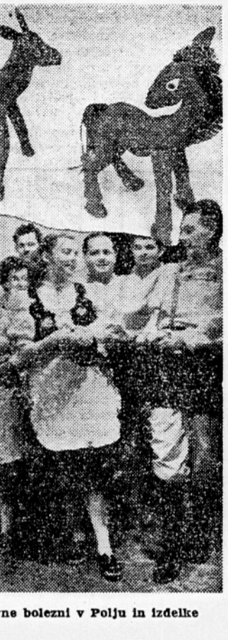
Slika prikazuje orkester in folklorno skupino bolnišnice za duševne bolezni v Polju in izdelke umetne obrti, dela bolnikov

Sodobne prijeme zdravljenja koristijo tudi v bolnišnici za duševne bolezni v Polju, ki ima tudi zdravilnice z zgoraj omenjenimi lastnostmi. Ni namen tega sestavka, da bi naše bralce seznanili s strokovno platjo psihiatrske službe. Prikazati hočemo le življenje za zidovi bolnišnice v Polju in življenje izven nje ter odvrtni ljudi od zmotnih mnenj, da so bolniki v tej hiši obsojeni na do smrti.