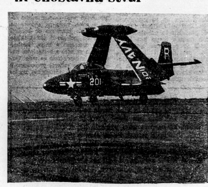
Pristanek reaktivnega letala na letalonosilki

Kdorkoli je že kdaj s kopnega skočil v čoln, si lahko misli, kakšne preglavice dela pilot pri pristanku na palubi letalonosilke. Letalonosilke so iz višine nekaj 100 metrov izredno majhne in piloti, ki so v službi na letalonosilkah morajo biti izredno veščti, da zaustavijo letalo na razmeroma kratki palubi. Dandanes pristane vsak dan na letalonosilkah po nekaj sto letal. To je omogočilo tesno sodelovanje med piloti in konstruktorji. S staljša konstruktorjev je bila najtežja naloga: konstrukcija koles letala, ki morajo izmed vseh delov letala