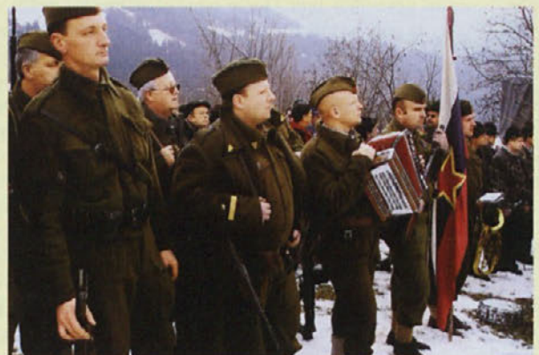
Skupina Triglav, Dražgoše, 9. januar 2005

Razstava orožja in opreme, ki jo pripravlja skupina TRIGLAV, ter slik iz NOB, ki jo pripravlja ZGODOVINSKO DRUŠTVO MEDVODE, bo odprta še 5. in 6. MAJA 2005 od 10. do 16. ure!!