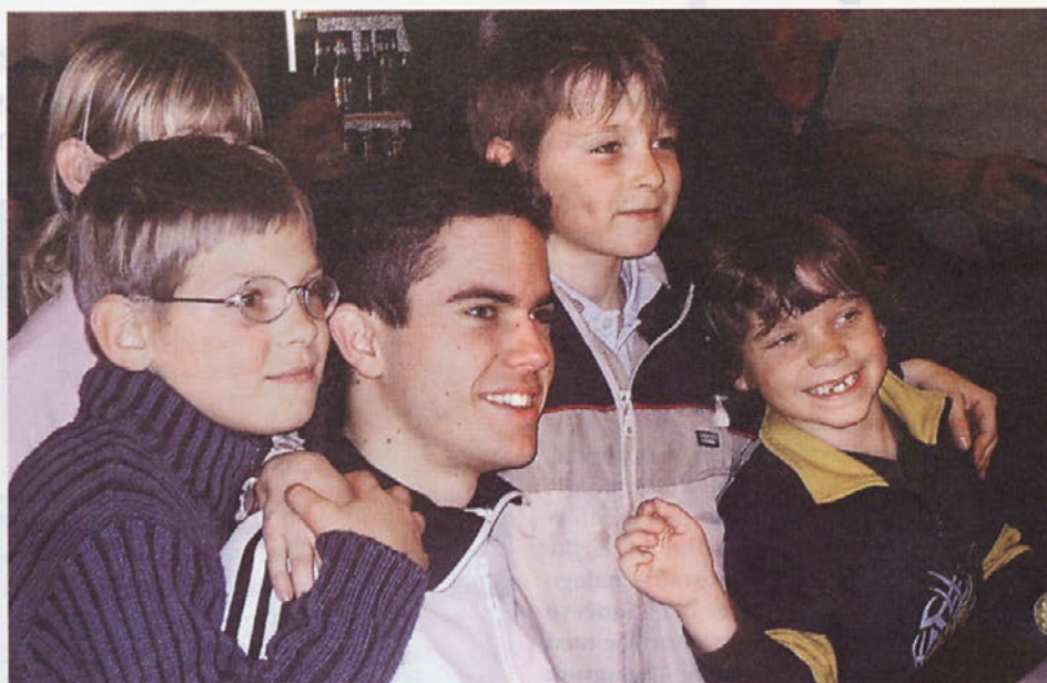
Jernej med najmlajšimi Ilirjani.

"Skakalec me je vprašal, če plesat grem z njim. Ne, s skakalcem pa ne. Cel dan po zraku leti, zvečer pa kot klada zaspi ..., " tako so zapele Polončice iz Sore bronasti ekipi z letošnjega svetovnega prvenstva v Obersdorfu. Sledil je smeh, simpatični in vedno nasmejani Jernej Damjan pa je vsem mladim skakalcem, ki so pridno zbirali podpise, priporočil, naj tako pridno tudi trenirajo, da bodo tudi oni lahko nekoč imeli govor - tako kot tokrat on.