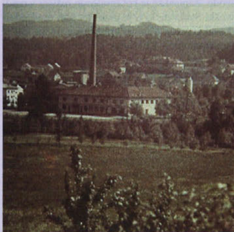
Fotografije iz filma Ljudje med barvami.