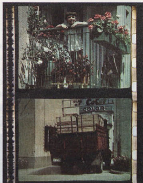
Fotografije iz filma Ljudje med barvami.