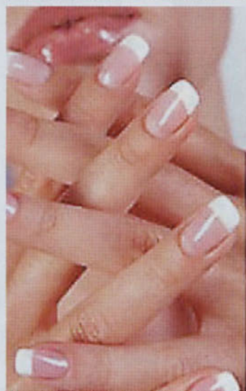
OBLIKOVANJE UMETNIH NOHTOV

Delovni čas: od ponedeljka do petka od 8. - 19. ure, sobota po dogovoru