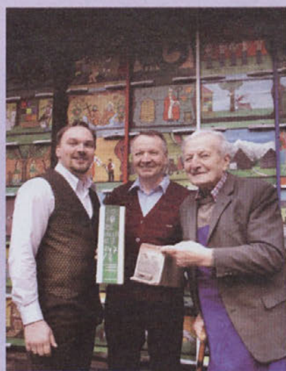
Za vas beležimo čas Gorenjski Glas

Trije rodovi Bukovškovih. Več na strani 13