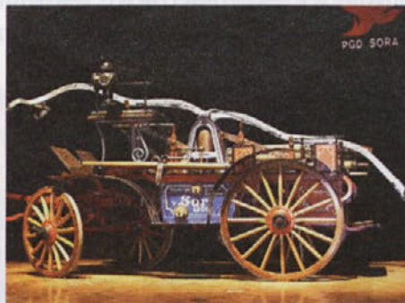
Ročna brizgalna iz leta 1906