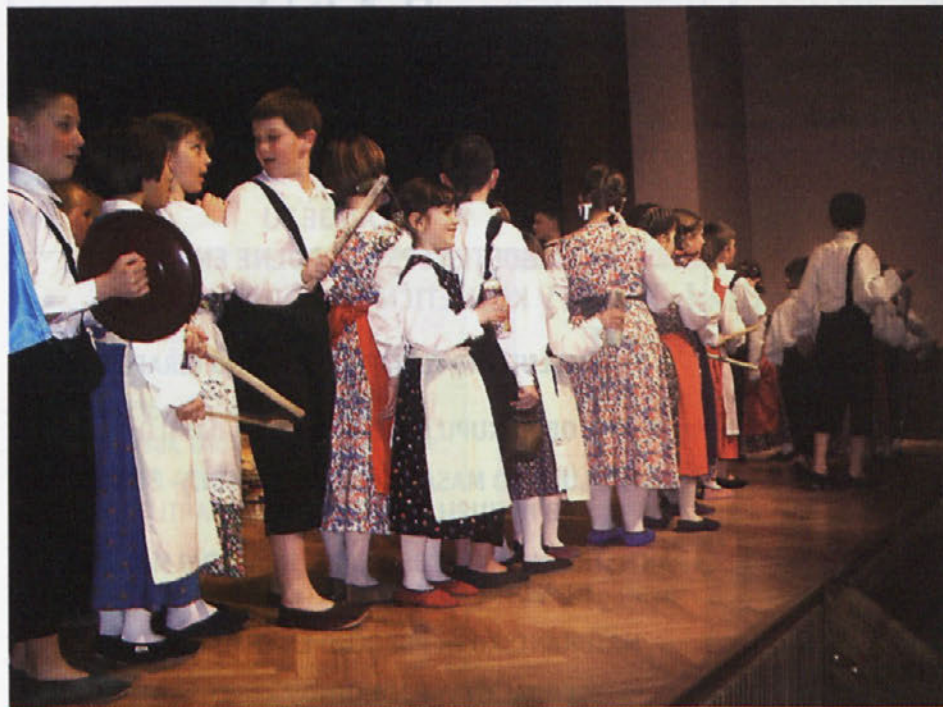
Sorški najmlajši "ofirajo" mamicam.