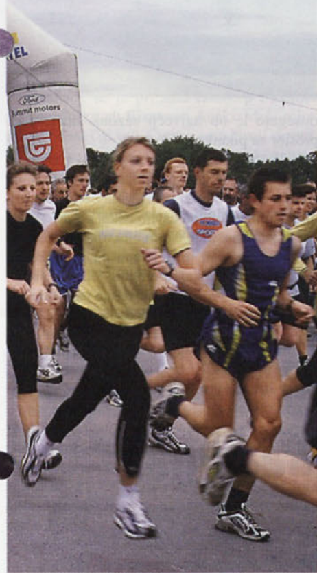
Redno gibanje in zdrava prehrana sta učinkovita pri odpravljanju celulita.