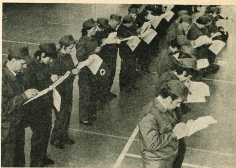
Občinski odbor RK je tudi letos organiziral tekmovanje ekip prve pomoči. Zgoraj: Tekmovalne ekipe pri razreševanju teoretičnih vprašanj. Spodaj: Tekmovalna ekipa Mengša pri praktičnem delu tekmovanja, zasedla je 1. mesto