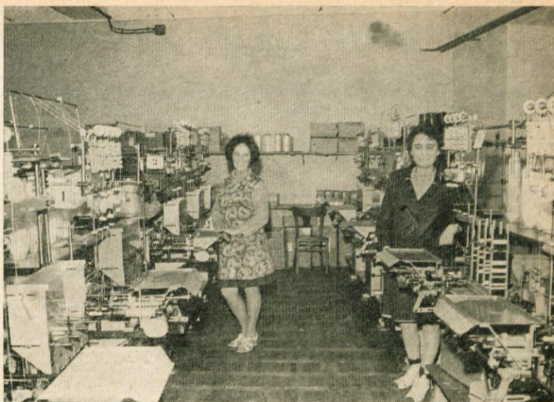
Oddelak novih sodobnih navijalnih avtomatov

Še nekaj besed o razvojnem programu naše delovne skupnosti. Vsa nadaljnja investicijska vlaganja v modernizacijo strojnega parka so več ali manj pogojena z zahtevo po novih tovarniških prostorih. Tovarna, v kateri danes dela skoraj 200 delavcev, je postala pretesna. Pogoji dela v nekaterih oddelkih so slabi in v vseh primerih ni mogoče razvijati organizirane proizvodnje.