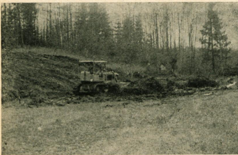
Bodoče igrišče HK Prevoje

ganizatorji znašli v hudih težavah, ker pri nas ni mogoče kupiti hokejske opreme. Najprej, ko še niso nastopali v ligi, so si igralci delali opremo kar sami, potem pa sta jim v veliki meri in z velikim razumevanjem priskočila na pomoč HK Olimpija in HK Slavija, ki sta jim dala opremo, čeprav je bila ta stara. (Srednje dobra oprema za igralca stane okrog 500.000 S din, za vratarja pa 1.000.000 S din). Vpisali so se v hokejsko ligo in pokazali so se prvi uspehi. V tej ligi nastopajo že nekaj let in vedno se držijo pri vrhu lestvice.