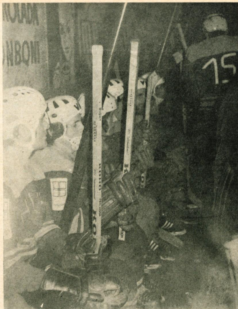
V pričakovanju zamenjave

trebnega treninga. Pomoč so poiskali pri upravi hale Tivoli v Ljubljani, ki je zelo razumevajoča. Toda trening še vedno stane 40.000, tekma pa 120.000 S din. Klub dobi od Občinske zveze za telesno kulturo malo denarja. Ta se porabi izključno za plačilo uporabe hale Tivoli in za vožnje. Drsalke, palice, čelade in drugo drobno opremo morajo kupiti igralci sami. Zato za igralce HK Prevoje lahko rečemo, da so najbolj čisti amaterji, še več, entuzijasti, ki skrbijo za potešitev svojih športnih želja in afirmacijo majhnega kraja v domžalski občini. Mnogi v občini ne vedo, da ta klub sploh obstaja, toda hokejski svet širom naše domovine ga pozna, saj smo