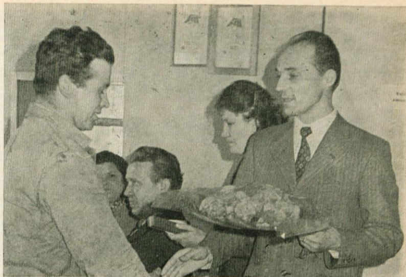
Na Opekarni Radomlje so obenem s praznikom dela proslavili tudi Dan opekarjev in Dan podjetja. Delavci, ki so ob težkem delu na Opekarni vztrajali deset let so prejeli lepe nagrade

Tov. sekretar je dodal, da je ta dan zelo pomemben za vse novosprejete člane ZK, da zavestno sprejemajo večjo odgovornost v družbi, da pomeni sprejem v ZKJ zrelostni izpit za družbeno-politično delo. S konkretnim delom bodo dokazali lastno aktivnost in mladostni polet — vrednost in kvalitete, ki so last Zveze komunistov.