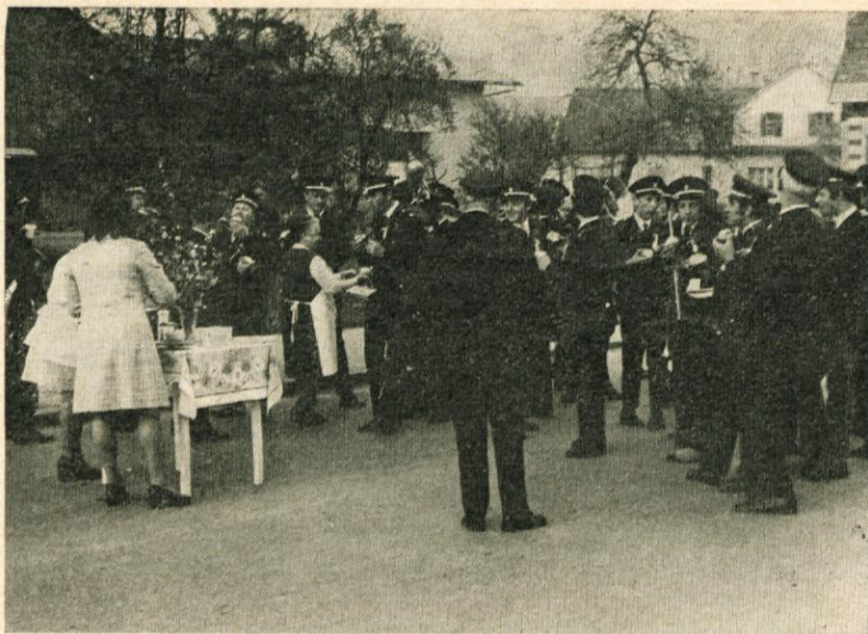
Tradicionalna budnica Domžalske godbe za praznik dela je vspodbudila »stobljane«, da so godbenikom pripravili prvomajsko okrepitev s krofi in vinom