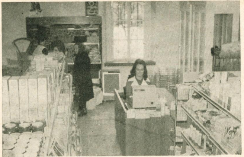
Občani Prevoj in okolice so končno dobilo sodobno samopostrežno trgovino