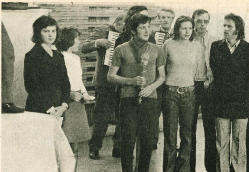
Mladina Domžal je bila tudi letos za kratek čas gostiteljica »štafete mladosti«. Na sliki nosilci štafetne palice