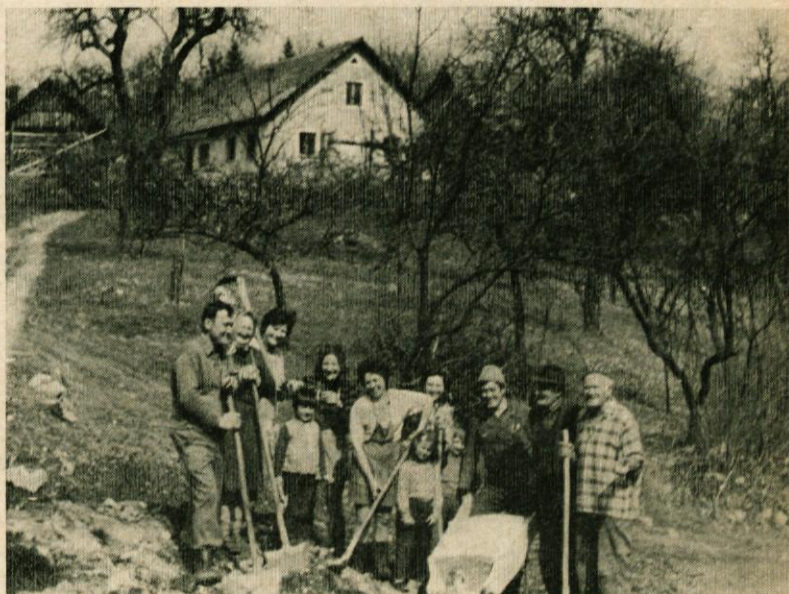
Vaščani Dobena, na »delovnem samopriskrbi« na cestni relaciji »Ručigaj —Gornje Dobeno