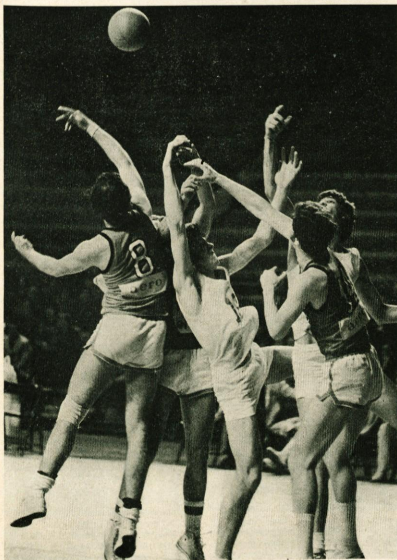
V borbi za žogo Celje : Domžale