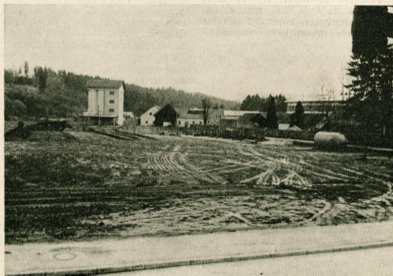
Program izgradnje stanovanj v občini Domžale predvideva letno 400 novih stanovanj. Novo ustanovljena samoupravna skupnost za to področje se bo vsekakor trudila, da bo program izpolnjen. Slika prikazuje pripravljala dela za izgradnjo 143 stanovanjskega bloka ob Kidričevi cesti v Domžalah