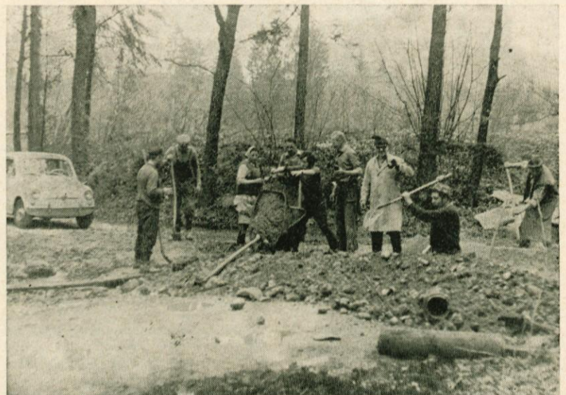
Prebivalci vasi Hudo so zopet zbrani na eni izmed delovnih akcij. S prostovoljnimi delom in s prispevki so v svoji vasi naredili že marsikaj. Še nedavno zelo slaba cesta skozi vas je sedaj asfaltirana in že se lotevajo drugih »kritičnih« točk v svojem kraju