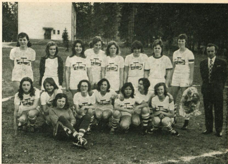
V Domžalah imajo tudi ženski nogomet. Na gornjem posnetku je moštvo, oziroma »ženstvo« Domžal tik pred tekmo z Mariborčankami, dne 2. 4. 1973 v športnem parku v Domžalah. Za tekmo je bilo izredno zanimanje, saj se je na sila zanimivi tekmi zbralo več kot tisoč gledalcev. Ženski nogometni klub Domžale vabi v svoje vrste dekleta, ki se navdušujejo za nogomet

Za Mengšani so doživeli isto usodo prvo nedeljo v maju tudi Jaršani v Črnučah. Kaže, da je tudi v tem razredu vse odločeno, prestop v višji rang tekmovanja je najbrž zagotovljen sosedom iz Črnuč.