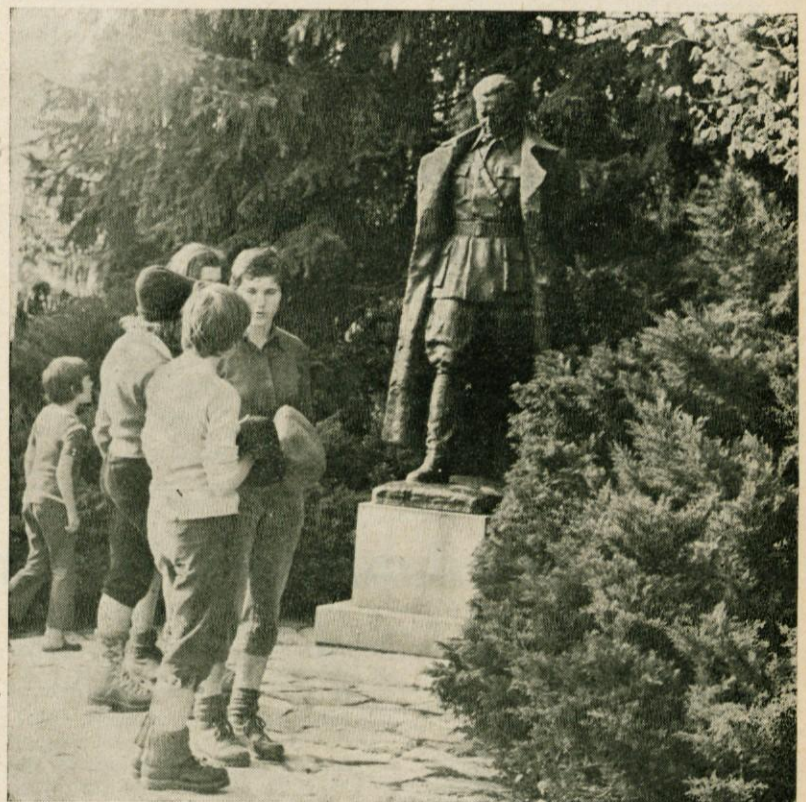
Mladi planinci iz Radomelj in okolice so se v prazničnih dneh podali na zasavsko planinsko transverzalo, ki so jo pričeli pri rojstni hiši tovariša Tita v Kumrovcu

Upravni odbor sklada za štipendije in posojila SOB Domžale