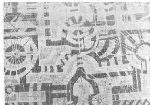
Nanevski Petar: »Arabeska«, olje