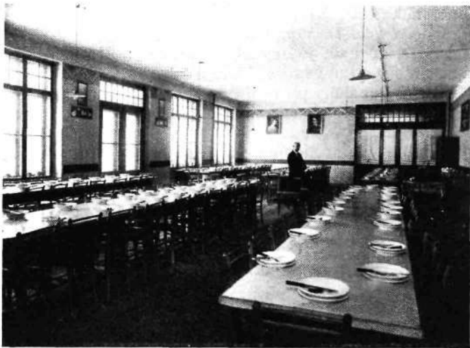
Mestno zavetišče — jedilnica

Med oskrbovanci so zastopani vsi stanovi. Nihče ne ve, kje in kdaj se bo zaključila njegova poslednja pot. Večini teh ljudi se danes godi bolje, kakor se jim je godilo kdaj v življenju. Mestna občina skrbi res vzorno, da imajo vse, kar potrebujejo, dobro in zadržati. Dvakrat na teden obišče zavetišče mestni zdravnik in takrat mu potožijo vse svoje fizične in duševne boli.