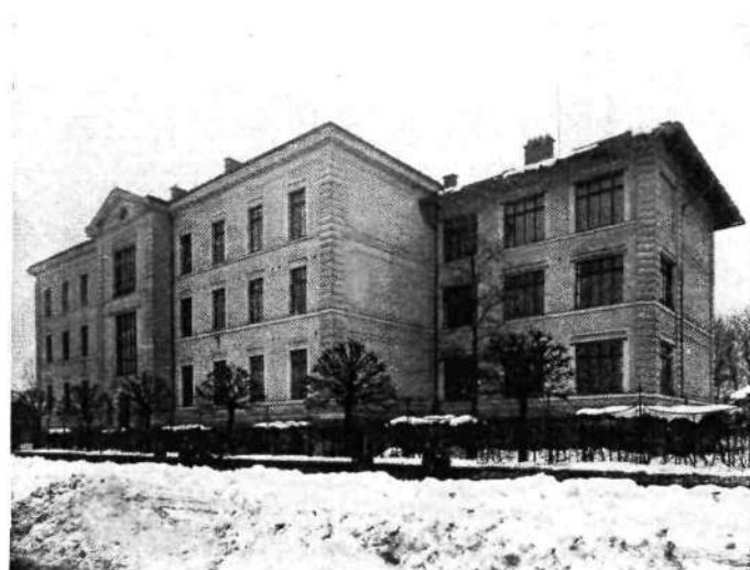
Mestno zavetišče za onemogle v Ljubljani

V suterenu je kuhinja z vsemi potrebnimi shrambami, pralnica, likalnica, pekarna, shramba za kruh, prostor za centralno kurjavo, sobe za služkinje, hlapca ter jedilnica za sestre redovnice, katerim je poverjena nega bolnikov, gospodinjstvo in poljska dela.