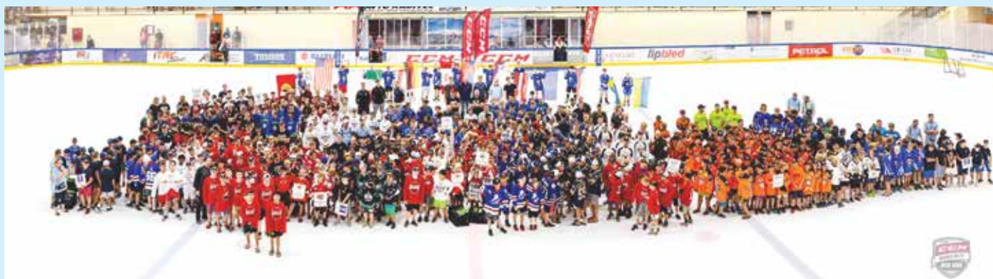
CCM WORLD INVITE BLED 2018

Več kot 1200 obiskovalcev, 30 ekip iz 12-ih različnih držav se je v začetku avgusta na Bledu mudilo v sklopu turnirja CCM World invite Bled 2018. V šestih dneh je bilo odigranih preko 140 tekem v petih ločenih starostnih skupinah.