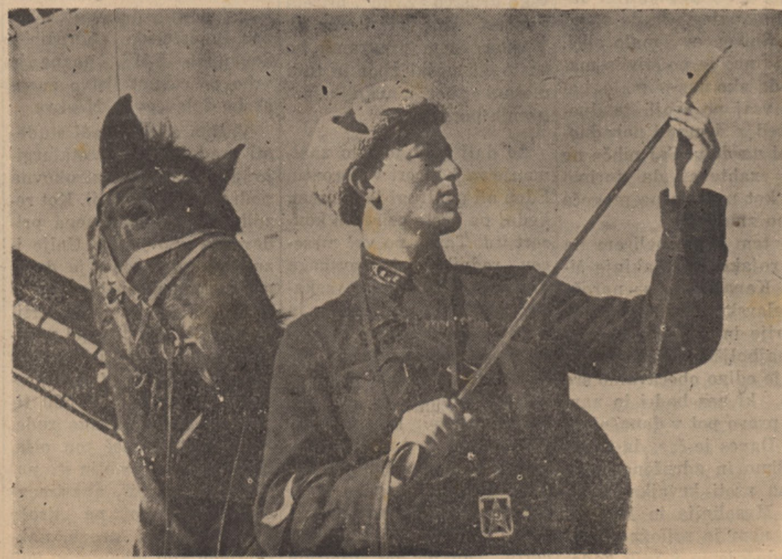
SOVJETSKI KOZAK PRIPRAVLJA OSTRO SABLJO ZA NACISTE.