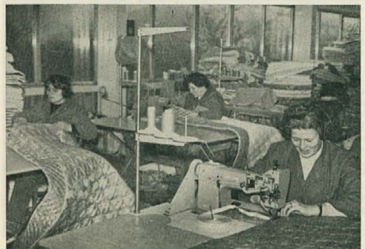
Šivalnica za vzmetnice