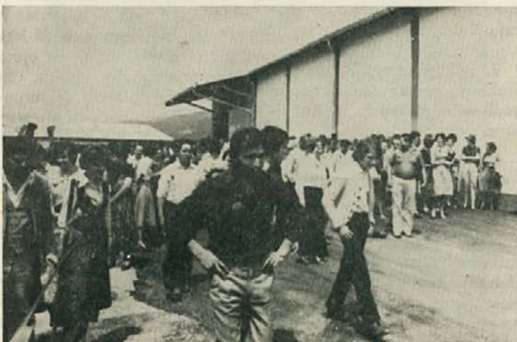
Po končani proslavi smo si ogledali nove proizvodne prostore