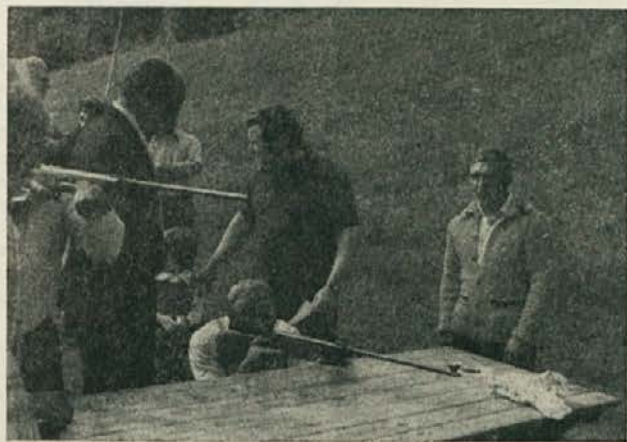
Na pikniku OOS TOK Gozdarstvo Radlje je bilo živahno. Pomerili so se v streljanju z zračno puško, skakanjem v vreči in vlačanjem vrvi.