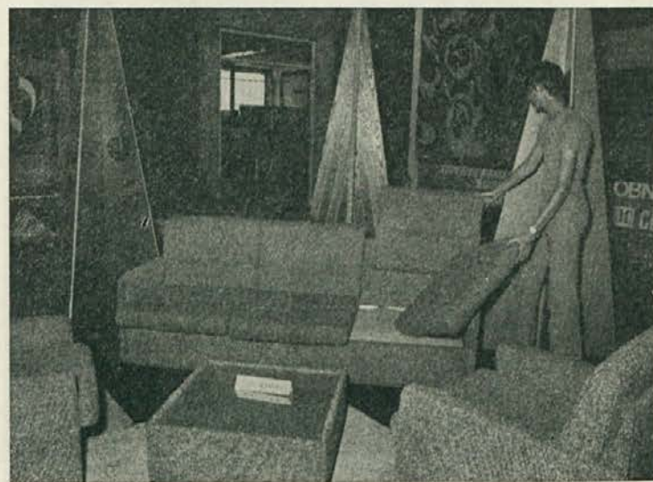
Sedežna garnitura — Žiga