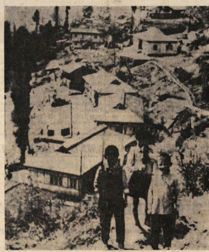
Slika iz stikanske prestolnice Gangtoka

varnostni svet sprejel dejanske ukrepe za rešitev vietnamskega vprašanja. Predsednik indijske vlade Sastry je v parlamentu izjavil, da ustanova spoštovanje ustavitve sovražnosti težave zaradi nepopolnosti Pakistana. Poudaril je, da se ne sme opustiti budnost, ker je še vedno dejanska nevarnost, zlasti pakistanskih vdorov v Kašmir. «Indija, je dodal Sastry, poudarja, da je Kašmir sestavni del indijskega ozemlja in da je kaš-