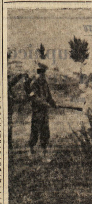
Na nekem griču pri Firencah so opazili dva gada na mestu, kamor prihaja mnogo otrok, ki se v bližini igrajo. Da bi nepotrebne in nepriljubljene — in še zlasti nevarne — živali pregnali, so se z metalci planovov spravili nad listje in draje. Upajo, da so s tem gade pregnali ali praznprav uničili

PARIZ, 24. — Da si urede hišo, bodo Francozi l. 1970 izdali dvakrat toliko kot leta 1960. To je ugotovitev neke študije državnega inštituta za statistiko, ki je objavljena v neki strokovni reviji. Tak prast ima vzrok v želji Francozov, da bi bile njihove hiše vedno bolj udobne. Tako se bo v primeri z letom 1960 za 90 odst. povečala nabava hladilnikov, pralnih strojev in televizorjev. Tudi oprema v ožjem smislu bo postala predmet posebne skrbnosti: nabava pohištva se bo povečala za 90 odst., tekstilnih proizvodov (zavesa itd.) za 97 odst., nabava predmetov za splošno družinsko uporabo pa bo narasla za 95 odst. Toda še prav posebno se bodo Francozi spsalili — čeprav morda nekoliko v zamudi z drugimi državami — v zbiranju različnih domačih električnih aparatov; na tem področju bodo na-