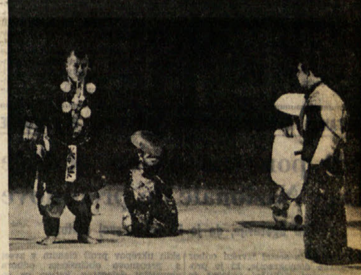
Eden od prizorov japonskega teatra «Kyogen» iz Tokia