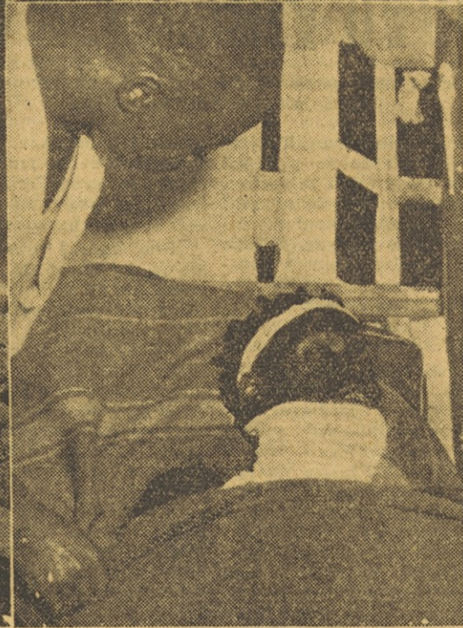
Levo zgoraj: Oči vsega sveta so bile v minulem tednu uprte v Berlin. Sovjetski zunanji minister Molotov in angleški zunanji minister Eden se ljubeznivo smehljata. Kdo ve, kaj se skriva za njunim smehljajem? — Desno zgoraj: Prizor iz Gvajane, ameriške dežele, kjer so angleške kolonialne oblasti nasilno vrgle zakonito vlado, ki se je zavzemala za neodvisnost — Levo spodaj: Sedanji perzijski režim le s težavo kroti uporne Mosadikove pristaše — Milijoni pa žive bedno življenje v puštinjah, kjer je kozarec vode največje bogastvo — Spodaj v sredini: V senci sueškega spora... Vojaške vaje civilistov v Egiptu — Desno spodaj: »Generala Chino«, enega izmed voditeljev osvobodilnega gibanja v Keniji, so ujeli kolonialni vojaki — Na sliki ga vidimo, ko leži ranjen v bolnišnici