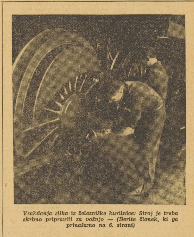
Vsakdanja slika iz železniške kurilnice: Stroj je treba skrbno pripraviti za vožnjo — (Berite članek, ki ga prinašamo na 6. strani)

Občni zbori delavskih sindikalnih organizacij so v polnem teku. Skoraj ga ni zbor, na katerem ne bi (vsaj jaz ne vem zanj) na tak ali drugačen način razpravljali tudi o družbenem položaju in poslanstvu delavca, delovnega človeka in o medsebojnih odnosih med delovnimi ljudmi v naših sedanjih družbenih prilikah. Seveda ponekod razpravljajo o tem podrobno, drugje neposredno in tudi na razne načine, to je, bolj ali manj zrelo, posplošeno, teoretično ali pa izključno na osnovi čisto praktičnih vprašanj in zapletov, ki jih vrže na površje vsakodnevno življenje. Značilno je predvsem to, da so razgovori o tej stvari zavzeli na letošnjih občnih zborih precej vidno mesto.