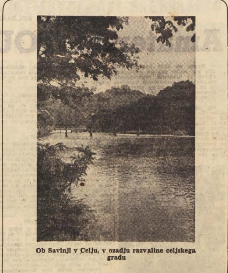
Ob Savinji v Celju, v ozadju razvaline celjskega gradu

Uprizoritev v dunajskem Volkstheateru je doživela senzacionalen uspeh. Dramo so igrali več kot mesec dni en suite. Ne popoldanske predstave, se prolongiranje ni moglo rešiti problema: kam z ljudmi. Vse predstave so bile do zadnjega kotička razprodane. Celo inozemski korespondenti, do katerih so dunajska gledališča vedno zelo uslužna,