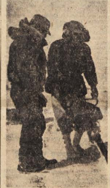
Preden so izbrali prostor za letališče, so s posebnimi aparati izmerili debelino ledene skorje

Zgradili bodo 39 raziskovalnih oporišč, s katerih bodo pregledali zemljepisne, fizikalne in rudninske razmere na področju 8 milijonov kvadratnih kilometrov. Za ležišča premoga že vedo, upajo pa, da bodo našli tudi nafto in celo uran.