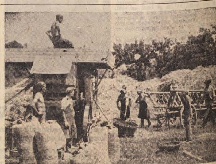
Mlačev Pridelek je obilen in ni večjega veselja kot vrečo za vrečo polniti z žitom

V skladu z naravnimi razmerami sta poljedelstvo in travništvo osnovni panogi pomurskega