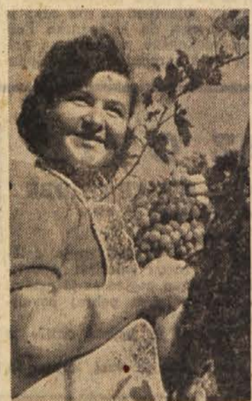
ZELO JE SLADKO! Ne bo več dolgo, ko si bomo lahko privoščili grozdje iz naših gor

Pri nekaterih poizkusih so namesto superfosfata vzeli Thomasovo žilindro, ki je med vsemi sorodnimi gnojili učinkovaleja najboljše, predvsem na kislih travnikih. Apno, ki ga vsebuje Thomasova žilindra, ublažuje kislost, vtem ko jo superfosfat še povečuje. Tudi železo