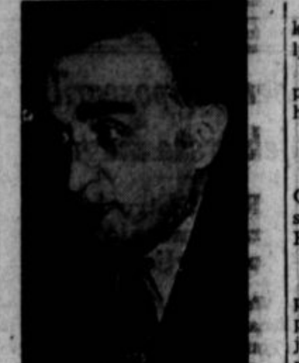
Senator Joseph O'Mahoney iz Wyominga je oni dan lopnil po velebitistu...