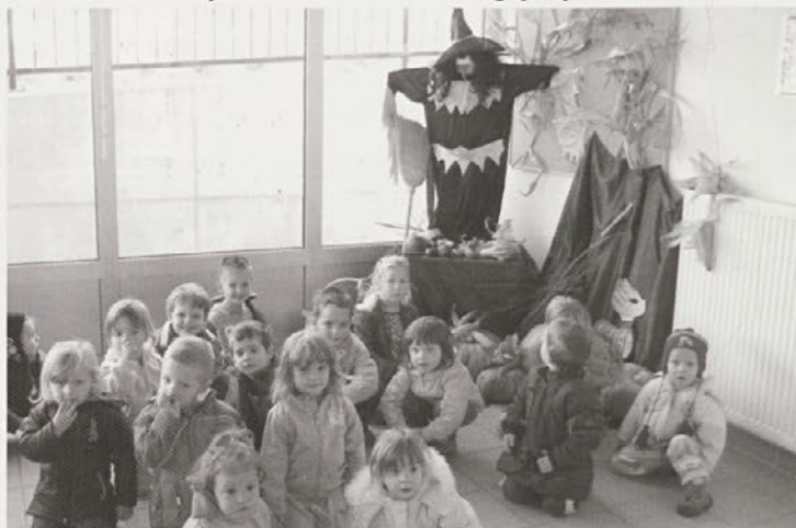
Razstava za noč čarovnic