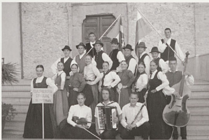
Gostovanje na Siciliji

Tega prijetnega večera ne bi bilo brez pomoči vseh sponzorjev in donatorjev ter vseh pridnih rok, ki so nam pomagale, in seveda brez vas, naše iskrene publike, ki je z nami igrala, jokala in se smejala. Naj ljubezni ogenj vedno gori v srcih.