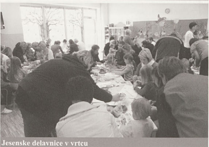
Jesenske delavnice v vrtcu