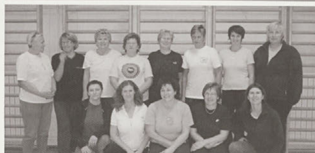
Udeleženke rekreacijskih večerov v športni dvorani v Cirkulaneh