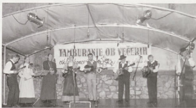
Tamburanje na Borlu - tradicionalno na Aninsko soboto

V jubilejnem letu kulture v Cirkulanah smo tamburaši znova začutili, da poustvarjanje haloškega glasbenega izročila najbolj ustreza našim željam po tamburanju; mogoče zato,