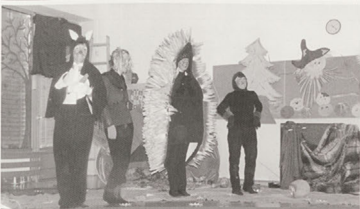
Igrica Doma je najlepše