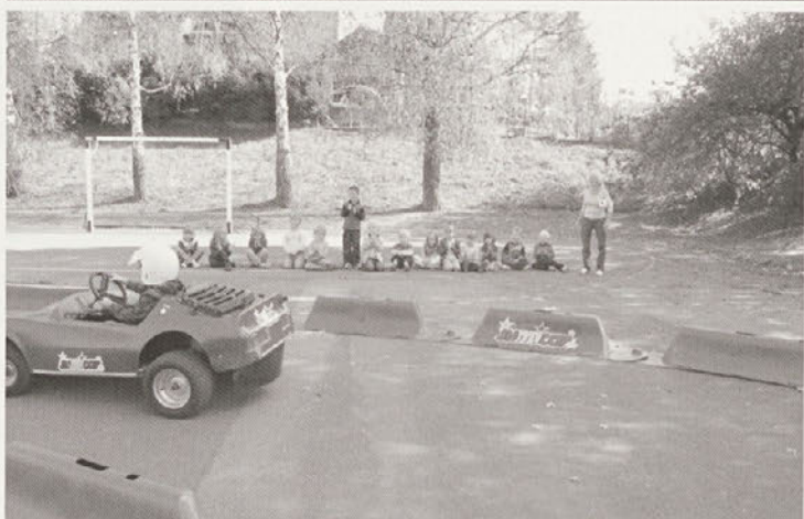
Avtomobili pri projektu Ulice otrokom