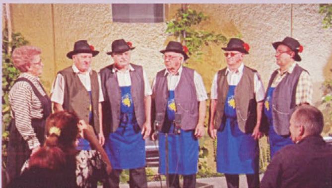
Ljudski pevci KD Cirkulane na nastopu v Ljubljani 25. septembra