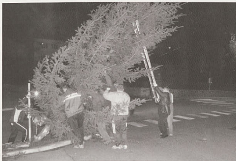
Postavljanje novoletne jelke pred občino Cirkulane

Kot se za veseli december in za haloško občino spodobi, je bilo seveda poskrbljeno tudi za pogostitev in prijetno ter veselo druženje občanov do poznih večernih ur.