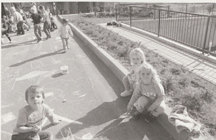
Projekt ulice otrokom