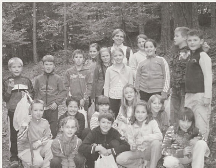
Učenci 4. razreda v gozdu (Jesenski plodovi, naravoslovni dan, 1.10.2009)