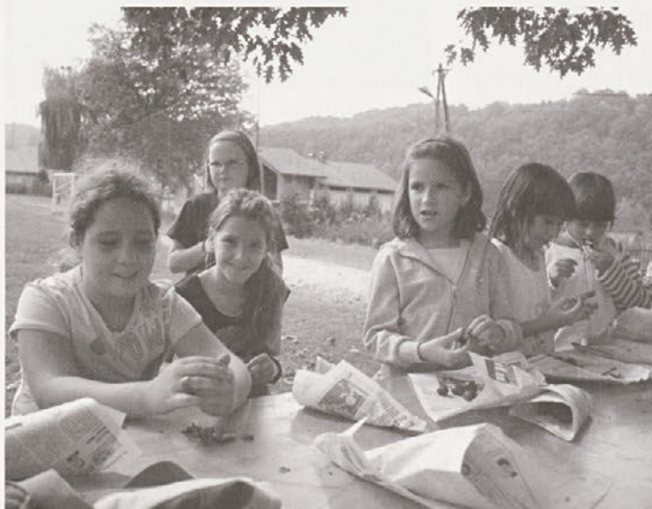
Četrtošolke se sladkajo s kostanji (Jesenski plodovi, naravoslovni dan, 1.10.2009)