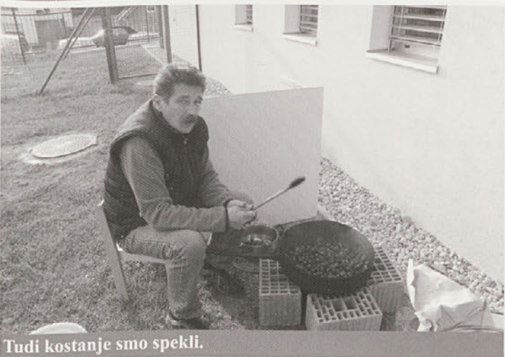
Tudi kostanje smo spekli.