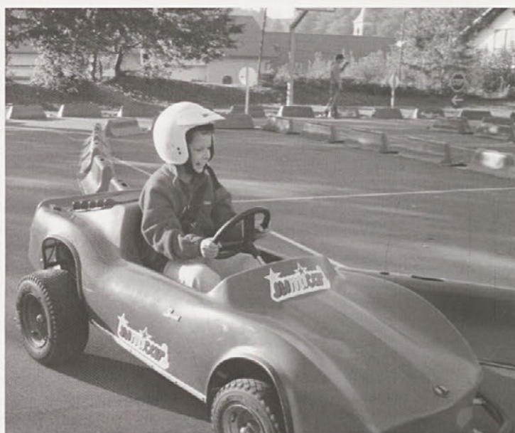
Zanimiva in zabavna vožnja z avtomobilčki (Ulice otrokom, 6.10.2009)