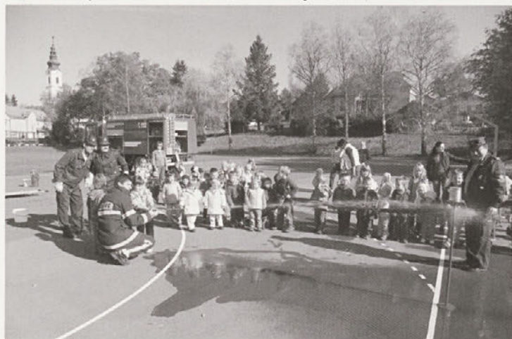
Gasilsko ciljanje z brentačo