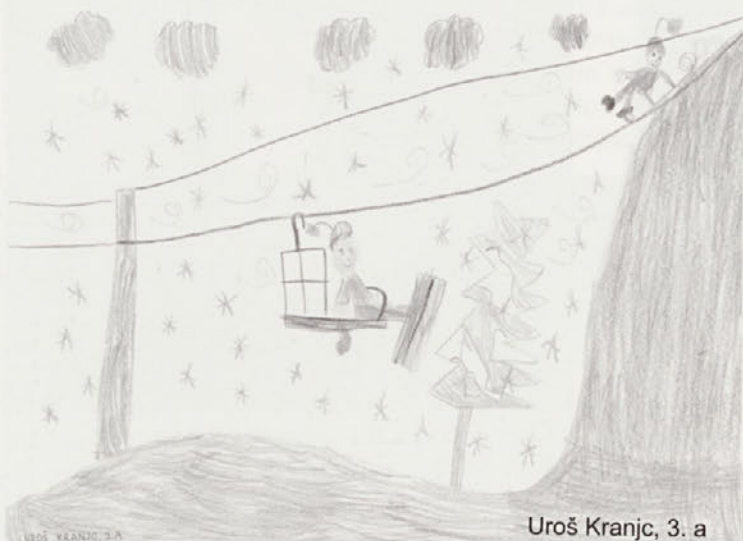
Uroš Kranjc, 3. a