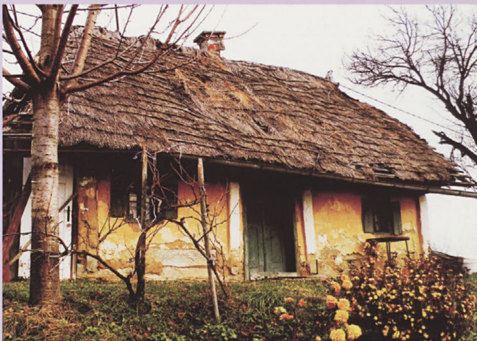
Ali je še čas za obnovo stare viničarije?

Pred leti smo skupaj z DVS Haloze načrtovali zbirko vinogradniško-kletarske opreme z vinoteko z namenom, da popestrimo turistično ponudbo na našem zaspanem ponosu. Idealni prostor smo videli v grajskih kletih, kjer nikogar ne bi motili. Grad še vedno sameva in propada brez pravega lastnika ali najemnika. Sli-