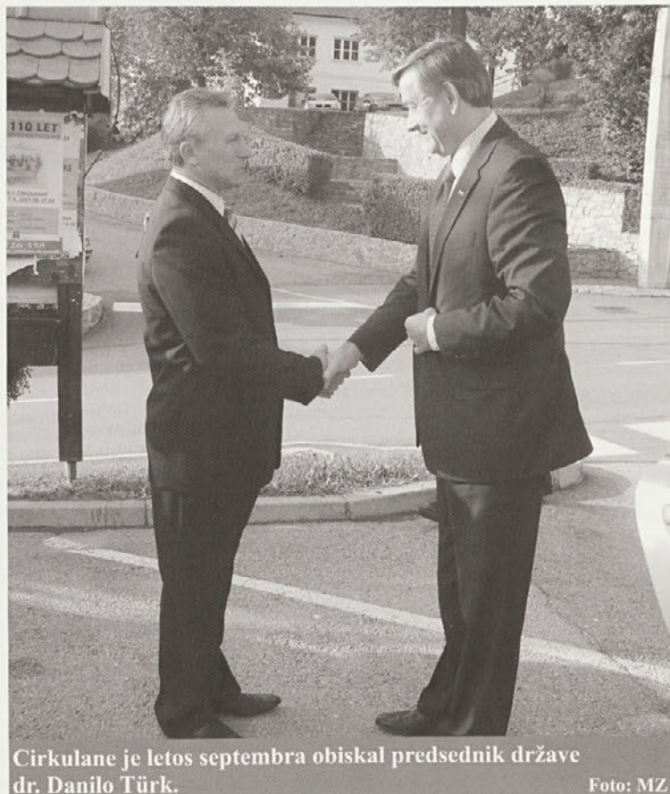
Cirkulane je letos septembra obiskal predsednik države dr. Danilo Türk.