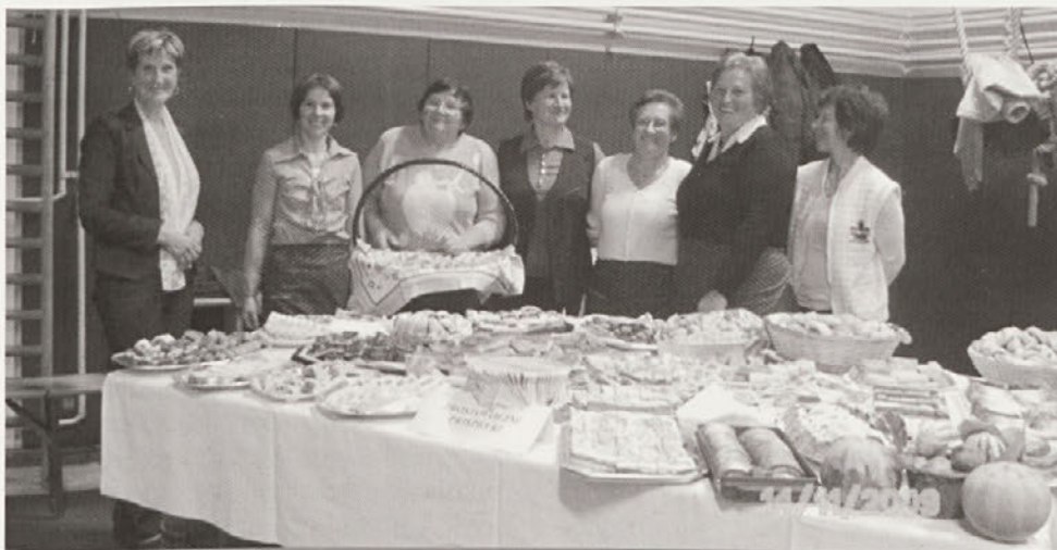
Fotografija s prireditve Martinovanje 2009, na kateri so se gospodinjje predstavile z različnimi dobrotami.

Vsaka gospodinja pa v svoji iznajdljivosti naredi to dobroto po svojem okusu in domačih navadah. V Društvu gospodinj Cirkulane ima skoraj vsaka članica svoj recept za pripravo sadnega kruha. Recept, ki je opisan, pa je izbran iz revije Kulinarčna Slovenija.