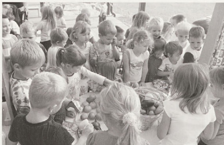
Jesenska tržnica na terasi vrta