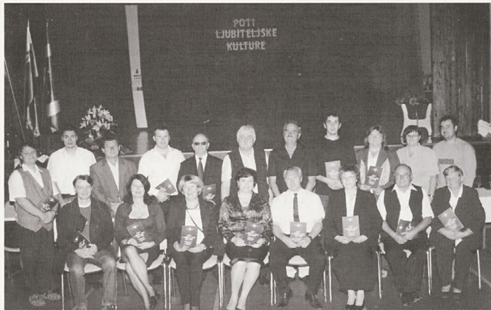
Slavnostna seja KD Cirkulane in predstavitve knjige Poti ljubiteljske kulture