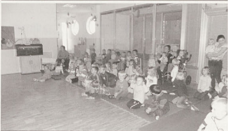
Otroci so si igrico z zanimanjem ogledali.