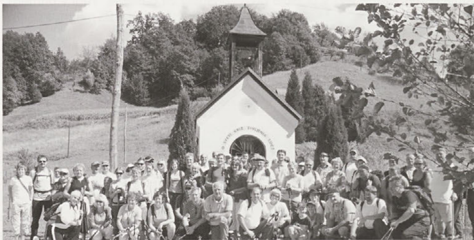
Udeleženci pohoda ob odprtju Bračičeve planinske poti

Celotna Bračičeva planinska pot je razdeljena v tri etape; je krožna in