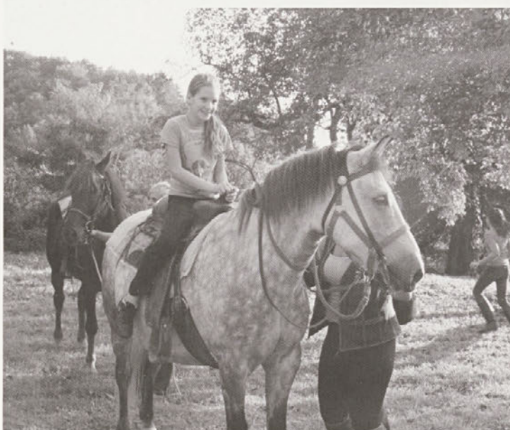
Uživanje ob jahanju konja (Pohod prijateljstva, športni dan, 5.10.2009)