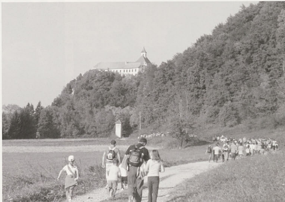
Učenci, njihovi starši ter učitelji so se podali na Pohod prijateljstva na grad Borl.

Ko smo bili vsi zbrani, sta nam učitelja športne vzgoje predstavila igre, v katerih bi se naj pomerili učenci in starši. Nekaj učencev je skupaj s starši tekmovalo v igrah, nekaj jih je igralo badminton, nekateri pa smo si ogledali grad. O gradu nam je vodička povedala marsikatero zanimivost. Na ogled so bile tudi stojnice,