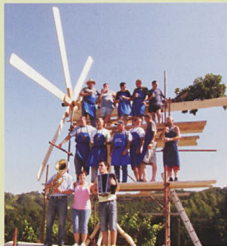
Ob postavljanju klopotca je bila tudi družabna prireditev.

pospravimo klopotce, saj so svoje poslanstvo opravili. Seveda pa je snemanje klopotcev pri nas spet razlog za veselje in druženje ter ohranjanje tradicije še enega običaja. Pri nas namreč velja, če gospodar klopotca do Martinovega ne pospravi iz gorice, se kar hitro lahko zgodi, da na mesto njega to opravijo drugi. In če ga želi dobiti nazaj, ga to seveda stane, največkrat mora pripraviti kakšno pogostitev z dobrotami in dobrim vinom.