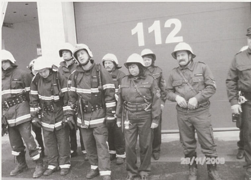
Operativni pregled PGD Cirkulane 29. novembra

Pred nakupom je dobro, če se posvetujete s strokovnjakom. Vsekakor