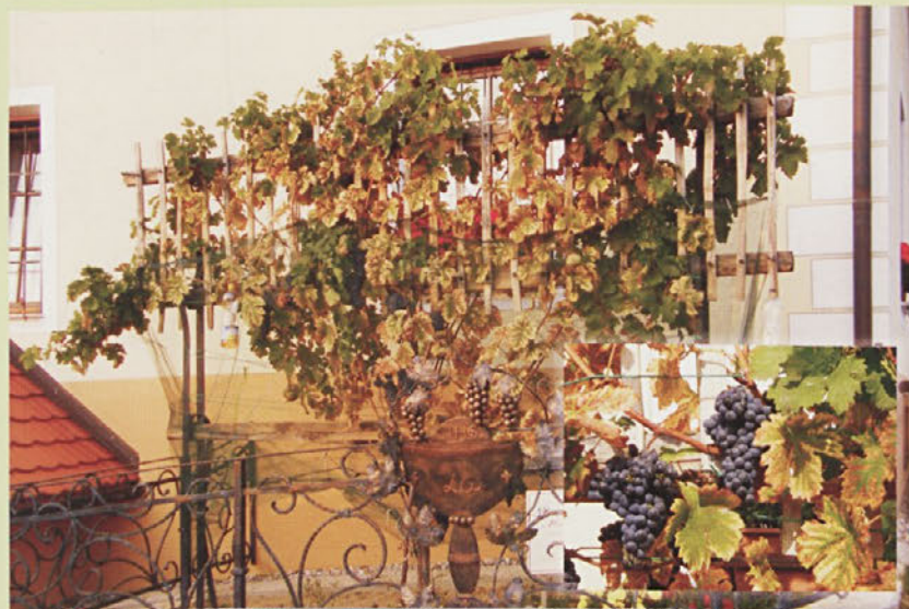
Jeseni so obrali prvi pridelok modre kavčine pri cerkvi Sv. Ane.

Pred dvema letoma smo vinogradniki ob cerkvi Sv. Ane posadili potomko najstarejše trte na svetu - kavčino oziroma žametovko. Po dveh letih je trta obrodila. Lep in bogat rod je bil priložnost za prvo trgatev.