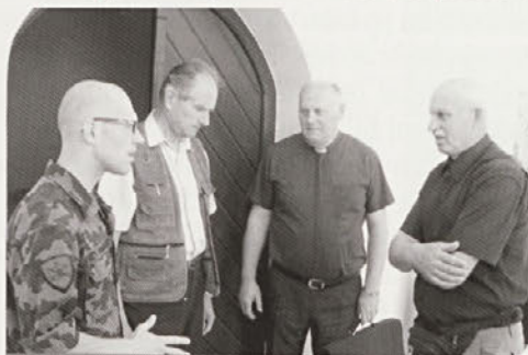
Srečanje vezistov Slovenske vojske in S5 radioamaterjev na lokaciji S59DDR v Pohorju in pri cerkvi Sv. Elizabete