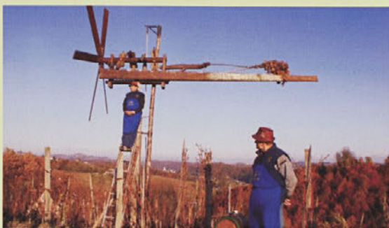
Jeseni - pred martinovim je bilo treba klopotec tudi podreti.

Mesec november je čas, ko je delo v vinogradih že opravljeno, ko se narava pripravlja na svoj počitek in ko se pokaže zadovoljstvo haloških vinogradnikov ob svojem pridelku. Je pa tudi čas, ko