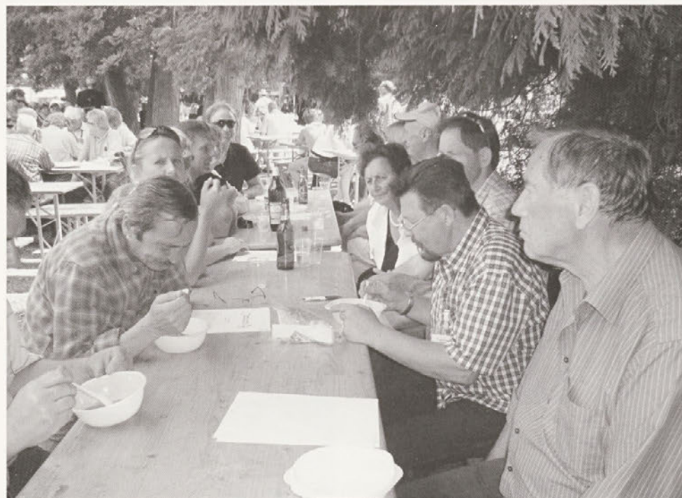
Utrinek z letošnjega ovčje-kozjega bala na Borlu

Ob koncu prireditve, ki se je odvijala pozno v noč, je predsednik DRD Haloze povabil vse ljudi dobre volje, ljubitelje živali in dobre, zdrave hrane, pripravljene iz mesa drobnice, da pridejo na naslednji Ovčje-kozji bal in obišejo tudi druge prireditve, ki jih organizira društvo.