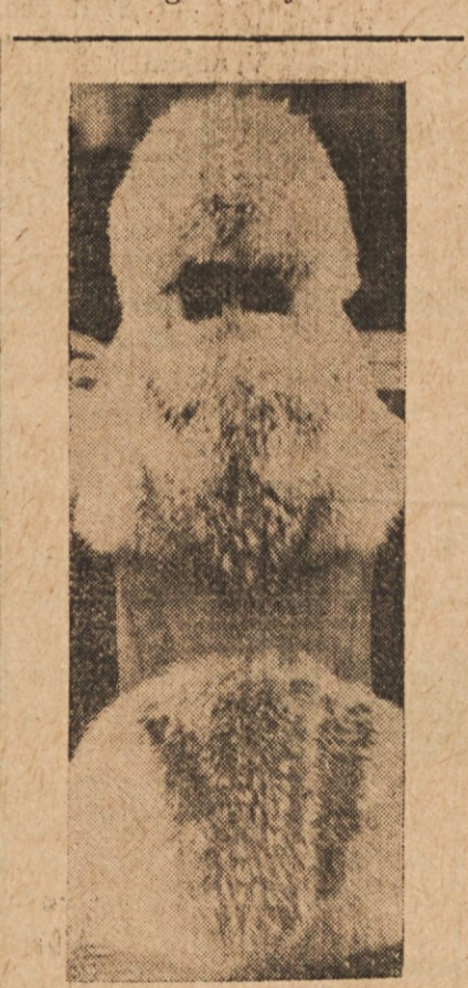
NOVA MODA — Slika kaže kapuco in rokavnik iz volčje kože za trdo zimo. Predstavljena sta bila na razstavi krznene mode v Frankfurtu na Nemškem.

plo ob truplu. Spravil sem se na kolena, da bi se povlekel do potoka. Grlo mi je kar gorelo. Radak, vlaški pešec Auersperg-Toda izza bližnjega grma se je gove čete. 'Beživa, gospod!' je pomolila črna glava. Turek me rekel. 'V dolini so vse naše puške napadeli kakor zver. Padel bil!' Radak si me je oprtal na sem na hrbet. Divjak mi je pokleknil na prsi, potegnil nož in zamahnil..."