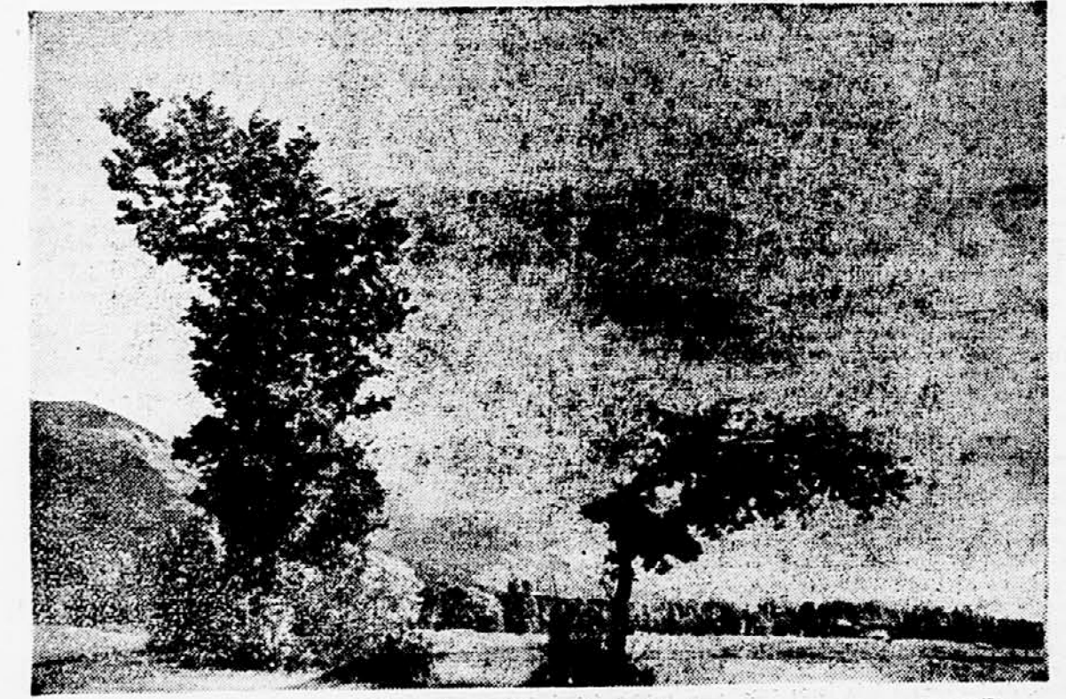
V jesenskem veštru

Vremenska napoved za sredo: V vsini predvina senčno vreme, pomanjka pozneje naraščajoča oblačnost. V nočnih urah zamegljeno, deloma niska oblačnost s krajevnim rosenjem. Temperatura se ne bo bistveno spremenila.