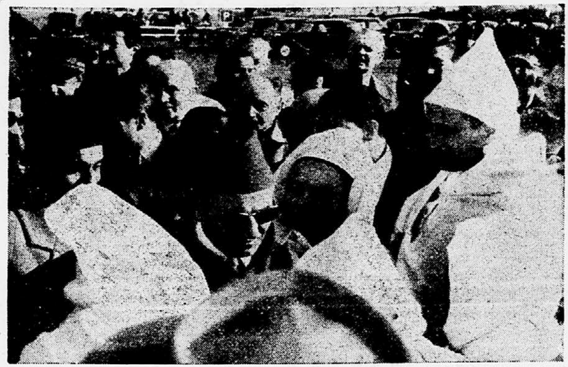
Maroški sultan Ben Jusuf se v Parizu posvetuje s francoskimi državniki o bodočem statusu Maroka. Kot znano, bo 16. novembra odpotoval v Rabat, kjer bo spet zasedel maroški prestol. Na sliki vidimo prihod Ben Jusufa v Pariz. Od leve na desno: princ Moulay Hassan, sultan Ben Jusuf, ministri predsednik Ben Slimane in član kronskega sveta Si Bekkal.