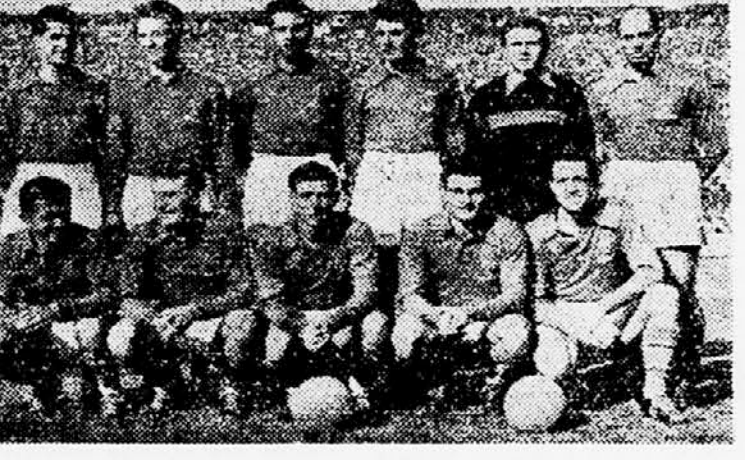
Francoska nogometna reprezentanca bo nastopila v petek na stadionu olimpijskega prvega državnega mostu v naslednji predstavi: Remeter, Louis, Marček, Penveren, Jonuš, Marcel, Foix, Glavočak, Kopa, Plantoni in Titovar.

VK Savica bo imel redni letni občni zbor v petek, 11. t. m. ob 19.30 v dvoranah Zavoda za socialno zavarovanje LRS, Kidričeva 5 (pritličje). Udeležba za članstvo obvezna, ostali vabljenti!