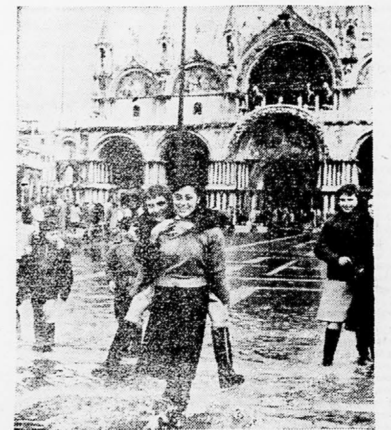
Medavna se hudi naravi povzročili pravo poplavo v Benetkah. Na sliki vidimo Benetčane na poplavljenem Markovem trgu.