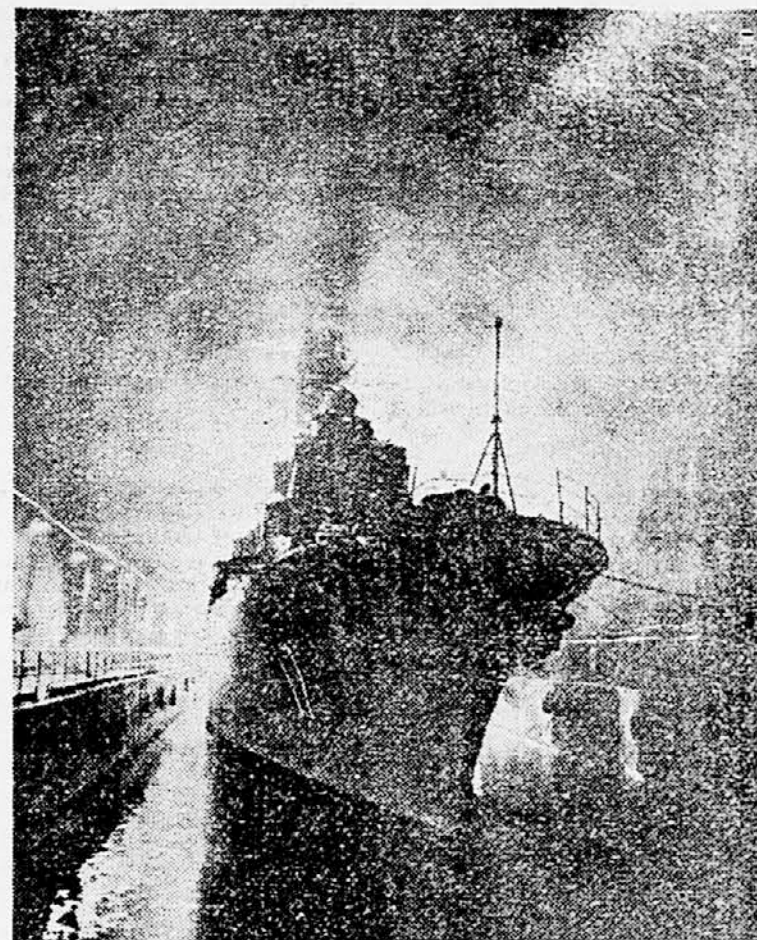
Kljub njeni nevtralnosti je znano, da ima Švedska eno izmed najmodernejših armad na svetu. Tudi mornarica ni majhna, kar je pa še več vredno. Je to, da je zelo sodobna. Pred kratkim so švedske oblasti izdale izjavo, da je eno tajnost. Oh vsem Baltiku so napravili v skandinavski obrežja posebne tunele, kjer lahko pristajajo tudi največje vojne ladje. Na sliki vidimo švedskega rušilca »Uplanda« (1820 ton) zasidranega v podzemskem pristanišču. Ta pristanišča so varna pred bombardiranjem, obenem pa so na ta način lahko dobro skrije razmeroma velika flota.