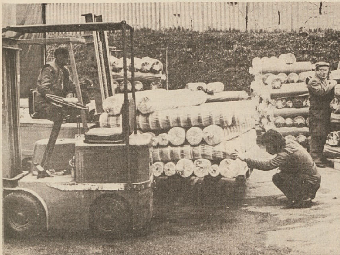
Prevzem blaga v skladišču osnovnih surovin za program PŠ