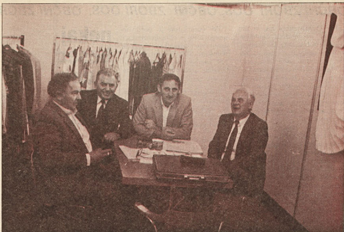
Labodovi trgovski predstavniki na za nas zelo uspešnem zadnjem beograjskem sejmu mode. Ob zlati košuti je bila dobra volja še kako upravičena

LIBNA: V tozdu Libna je to stalna praksa. Na njihovo pobudo so delavci zdravstvenega doma sprejeli to obliko, in ne le, da imajo možnost dobiti 4-urno bol-