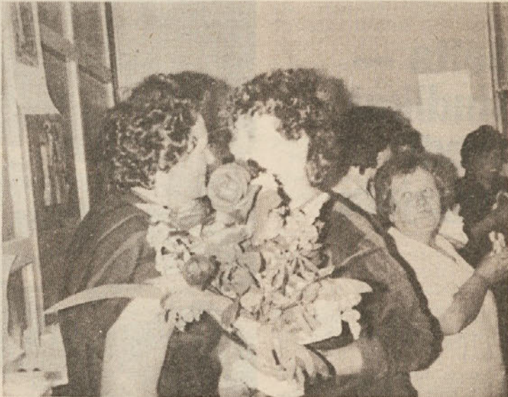
vpeljala v delo, tako da se bo delo tudi naprej lepo odvijalo, obe dolgoletni delavki pa se bosta zasluženo odpočili.