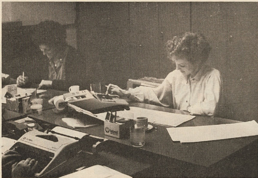
V računovodstvu tozda Delta

Kljub temu da pravimo, da smo bili na področju rekreacije, športa in kulture manj aktivni, smo tudi na teh področjih imeli nekaj uspešnih aktivnosti: razstava ročnih del skupaj z delavkami Lisce, lep rezultat so naše tekmovalke dosegle v namiznem tenisu ter streljanju z zračno puško, žal pa nam je, ker trenutno ne deluje v tozdu nobena kulturna skupina.