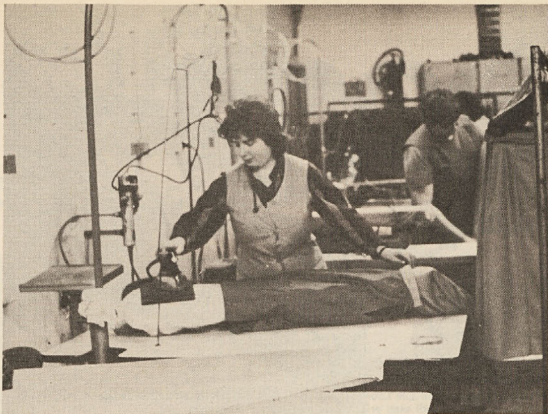
V proizvodnji Zale ima likalnica najtežje pogoje, zato zajema projekt investicij predvsem izboljšanje pogojev pri likanju.