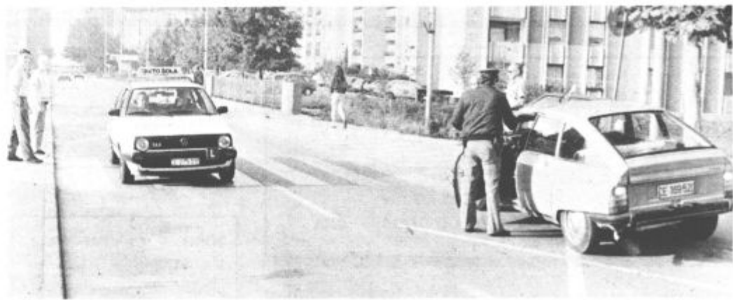
Kako omejiti hitrost na Jenkovi cesti?

Križišče Jenkove in Tomšičeve ceste je znano kot črna točka z največ prometnimi nezgodami v Velenju. Na komisiji so spet predlagali, da se v tem križišču že vendar kaj stori, da bo nezgod manj. Odločili so se da bi postavili semafor, čeprav so se nekateri nagibali k drugični, »humannejši« in cenejši rešitvi. Da bi križišče le razširili in določili prometne pasove za neoviran pretok prometa. Če bo zbran denar za ta namen zadoščal, bo do prihodnjega leta to križišče podoljšano (15 letih) dogovarjanj, opremljeno s semaforom. Prisotna so bila razmišljanja o zaprtju Jenkove ceste, ki bi narekovala