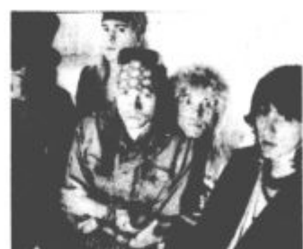
Najbolj popularen video doslej (glede na zahteve gledalcev) je bil Sweet child of mine težkometalne skupine Guns and Roses.

MTV, ki ne vrti nič drugega kot glasbene spote in koncerte 24 ur na dan, je pomagala pri ustvarjanju super zvezdnikov iz anonimnih glasbenikov; pokončala večino glasbenikov, ki niso