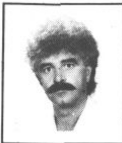
Piše: VINKO VASLE

Odpovedana stavka pa seveda ne pomeni, da so se žalski učitelji sprijaznili s svojim položajem in da so odstopili od svojih zahtev. Te bodo še vedno poskušali doseči v pogovoru z vodstvom občine; če ne bodo uspeli pa še vedno razmišljajo o štrajku. (k)