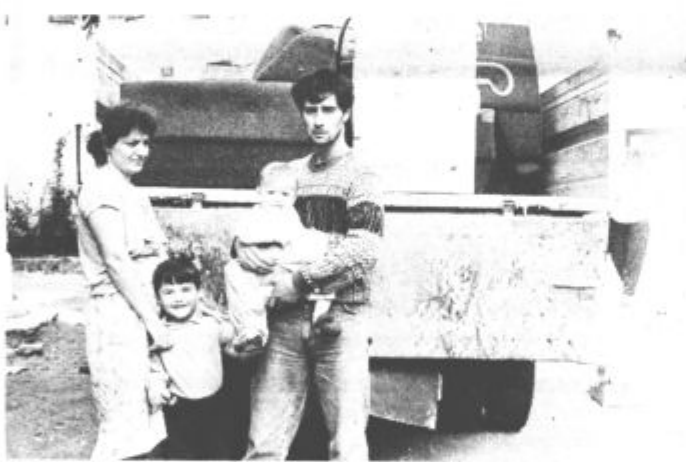
»Zakaj prav mi štirje?«

O vsem tem so nas obvestili po telefonu, tudi z obiskom v našem uredništvu. Nič drugače nas niso pričakali na terenu, kjer smo skupaj z njimi nemo opazovali prisilno odnašanje njihovega po-