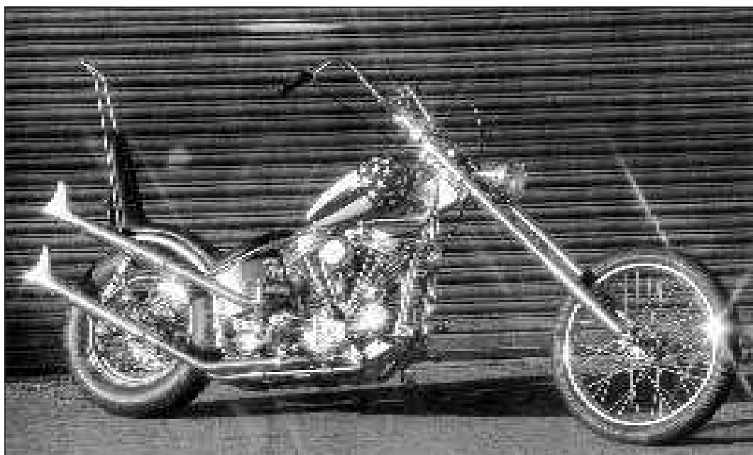
Legendarni Chooper iz filma Easy Rider

Že na začetku sem ugotovil, da so vsi motoristični klubi (MC) moški klubi. Takšen je tudi MC Rolling Bones. Tudi ustanovni člani kluba na njegovem ustanovnem sestanku leta 1989 so bili sami moški. Ti so se družili že v času osnovnega šolanja, ko so obiskovali isto osnovno šolo in poslušali podobno glasbo – rock.