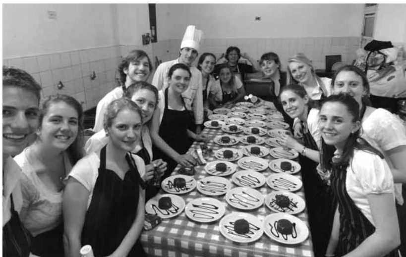
Pridna in delavna pristavska mladina