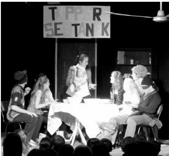
Zgodba je bila originalna in zanimiva

V nedeljo 7. oktobra je na Pristavi krajevna mladina pripravila 42. Mladinski dan. Dela so se lotili z veliko ljubeznijo in z željo, da bi slovenska mladina iz vseh okrajev velikega Buenos Airesa preživela lep skupni dan v okviru molitve, prijateljstva, tradicije ter slovenske besede, ob športu in glasbi.