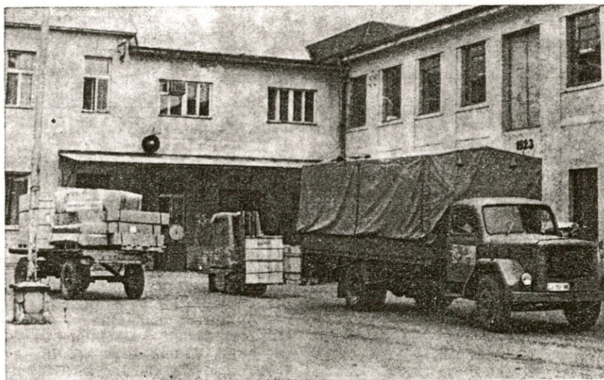
Vsakodnevna pomoč transportnih sredstev

goslavije vozijo in tudi v zamejstvo, tja daleč do Skandinavije. Tovornjaki, ki lahko peljejo tujino, imajo oznako TIR, kar pomeni, da je njihova pot pod zaščito mednarodne konvencije. Na mejnih prehodih tovore na teh tovornjakih ne pregledujejo cariniki, pa tudi plačilo uvoznih in izvoznih dajatev odpade.