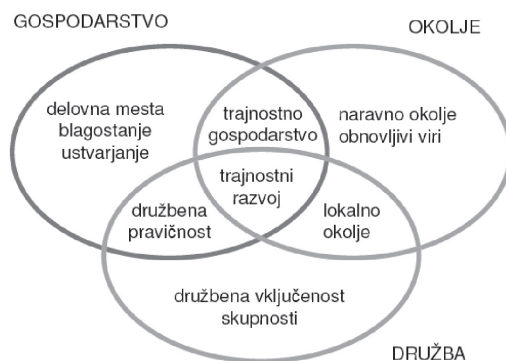
Slika 3: Komponente trajnosti, kot jih je navedlo Računsko sodišče EU (2005)