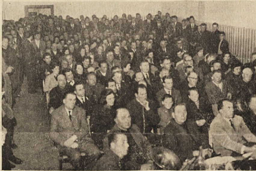
S proslave 20-letnice osvoboditve v Boljuncu