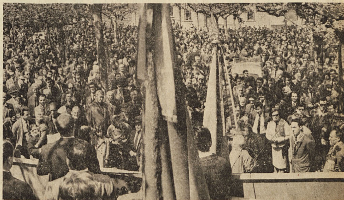
Prvega maja je bila v Trstu velika manifestacija. Osrednje delavsko zborovanje je bilo na Peruginjevem trgu. Delavske manifestacije z govori sindikalnih voditeljev so bile tudi v Miljah, Križu, Nabrežini, Tržiču in Gorici. Na sliki: zborovanje v Trstu.