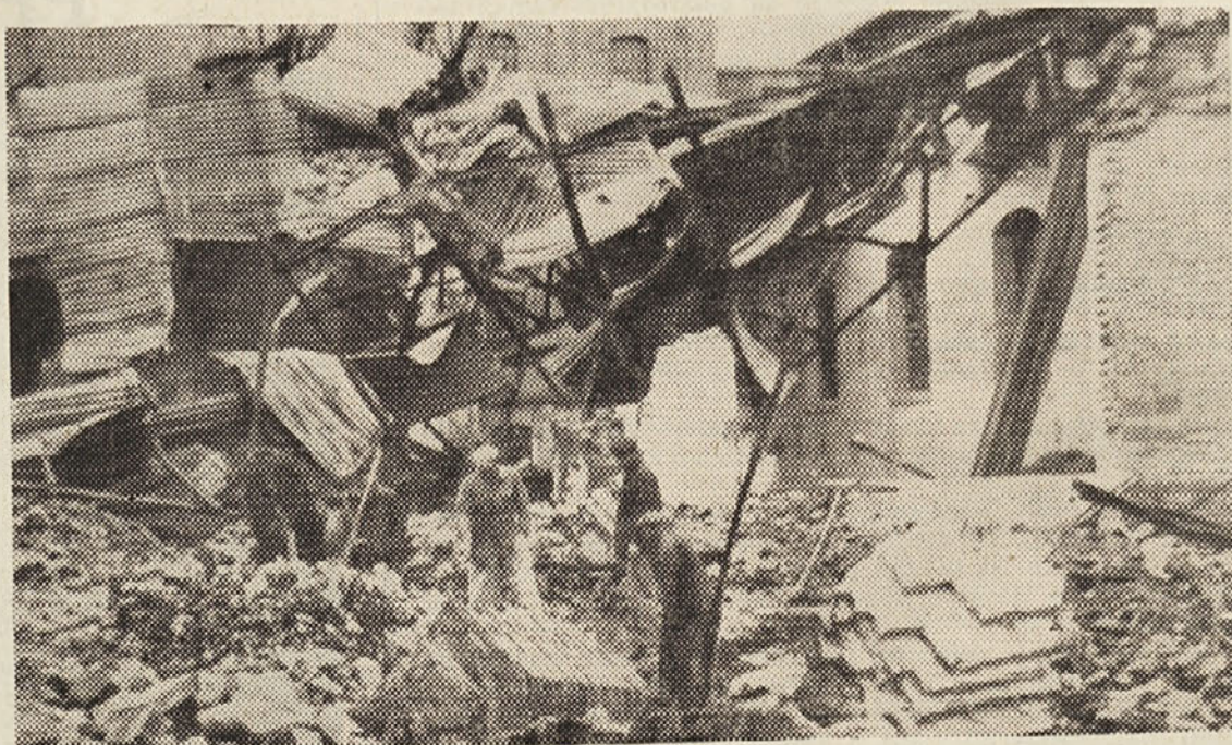
25. aprila 1965 so Rijarzo v Trstu proglasili na nacionalni spomenik. Rijarzo so nacisti spremenili v krematorij, v katerem so sežigali protifašiste in partizane. Žal, so proslave v tem svetem kraju izmalčili. Čeravno je bila večina žrtev slovenske narodnosti, niso uradni predstavniki spregovorili besede o Slovincih. Tudi škof, ki je maševal na kraju mučeništva — tokrat prvič — je pozabil da je po koncilskih določbah slovenščina priznana kot obredni jezik.

(Iz sestavka, ki ga je napisal sovjetski akademik E. Tarle in je bil objavljen 1. 1946 v «Krasnaji zvezdi»)