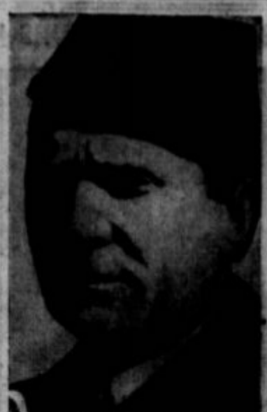
Maršal Tito, poveljnik jugoslovanske osvobodilne armade.

Urednik se tudi norčuje, ker sem dejal, da smo Slovenci majhen narod in gledamo na Rusijo