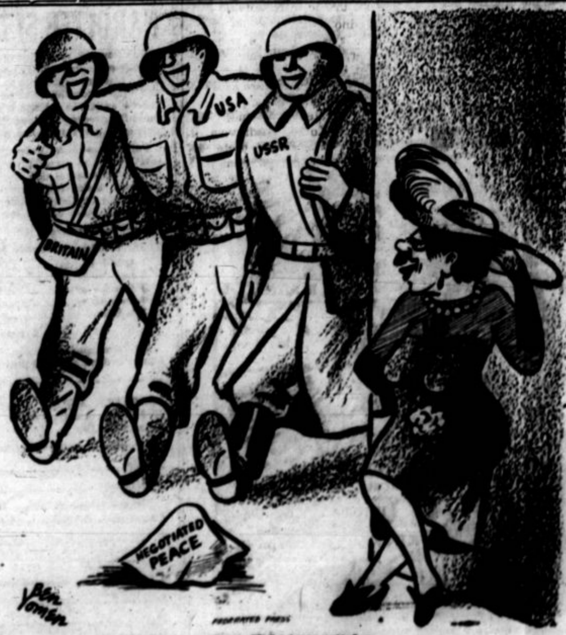
Nova Hitlerjeva svilaša.