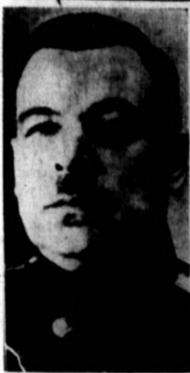
General Leonid Govorov, poveljnik ruske armade na leningrajski fronti.

"Še vedno dve... pa praviš, da bo kmalu jutro. Nikoli ga ne bo... jaz pa sem tako lačna." "Spi, pa ti bo minil čas." "Saj ne morem." Kot bi mu kdo vrtal v možga-