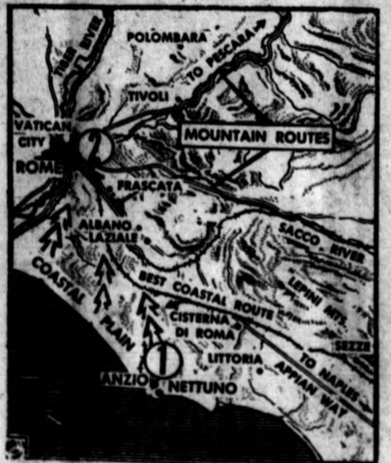
Italijansko obrežje v osadju nemške bojne črte, na katerem so se iskrcali ameriške in britanske čete.