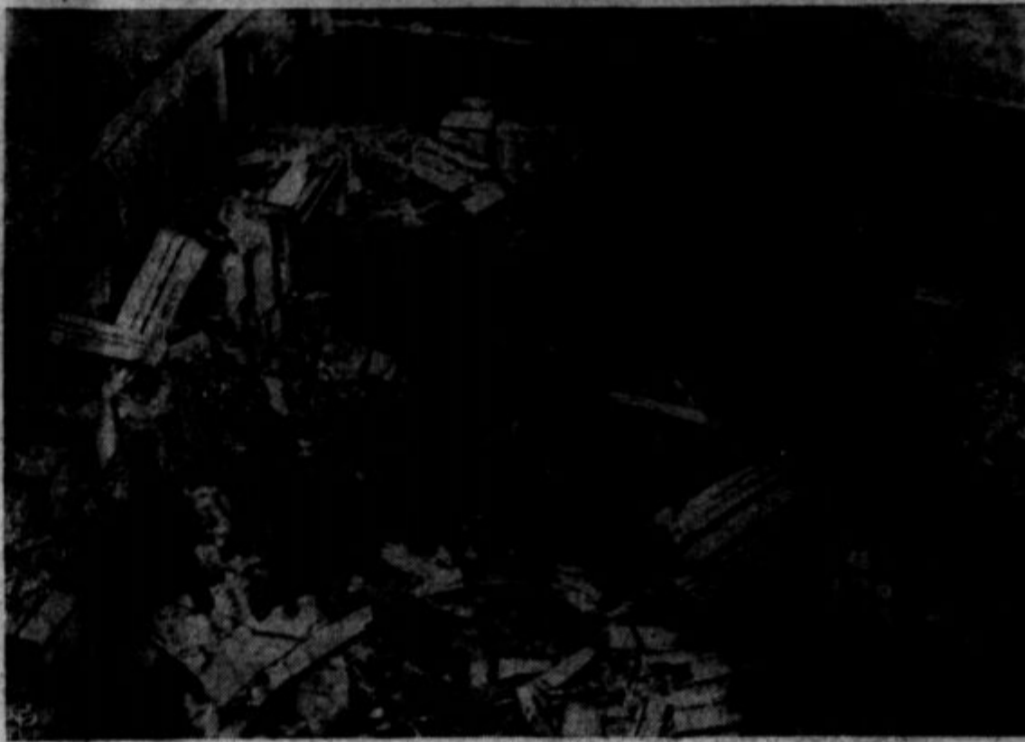
THIS IS THE FIRST PICTURE to reach this country showing the results of a time bomb placed in a cargo of oranges shipped to fruit-starved England from Spain. It subsequently was revealed that bombs placed by saboteurs had exploded in other cargoes of fruit, resulting in a controversy between the two countries.

Kaj bo, ko jih imam šest, ki odpirajo lačna usta, in sem jaz sedmi, a žena osmi?"