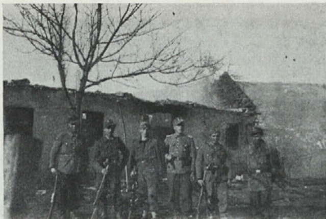
Po bombnem na- padu na Kalce 8. 4. 1945.