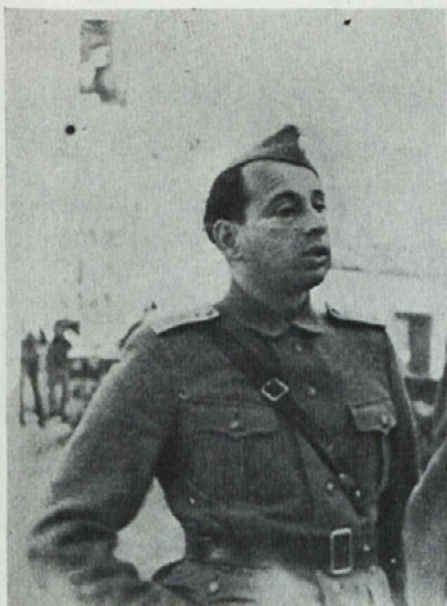
Stotnik Ice Rihar.*