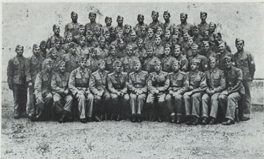
Podoficirski tečaj 1944 — Ljubljana.