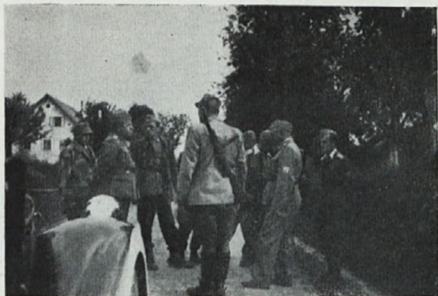
Razgovor med oficirji.