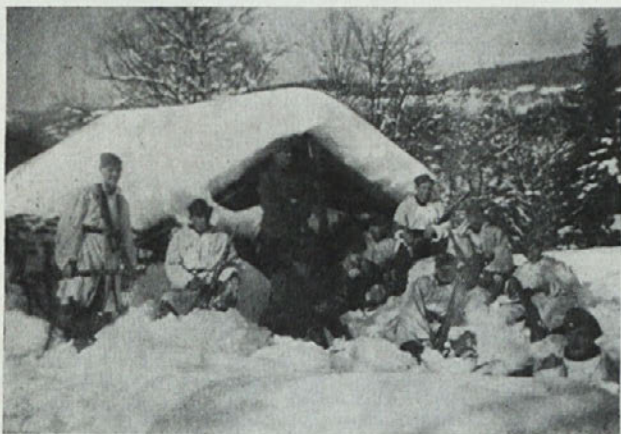
Pozimi v Stični 4. 1. 1945.