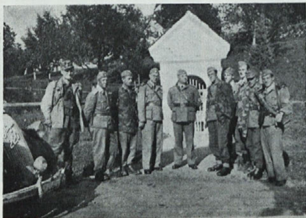
Ob obisku s štaba