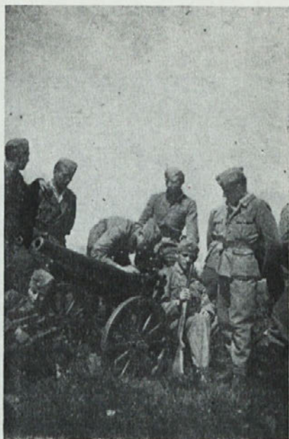
Topič je očiščen.*