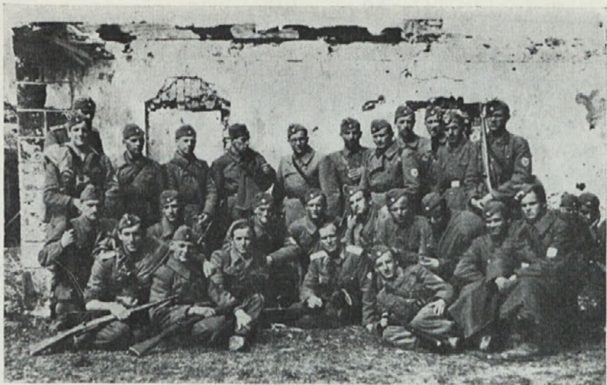
Odmor med pohodom.*