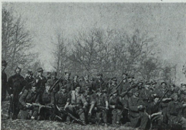
Pred Belo Krajino 14. 4. 1945.

Slike, katerih tekst je označen z * so bile v arhivu Vest- nika. Lastniki so neznani. Uredniš- tvo bo slike takoj vrnilo, ko se bodo lasniki javili.