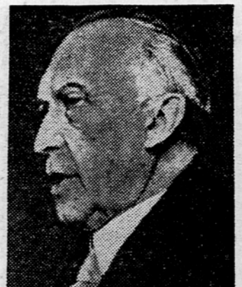
Dr. Konrad Adenauer

Washington, 19. jun. (AP.) Demokratski senator iz Minnesote Hubert Humphrey je izjavil sinoči, da bi bil obrambni sporazum med ZDA in Izraelom »najuspešnejši način za varnost in mir na Bližnjem vzhodu«. Le-ta bi bil ena izmed šestih točk »realistične politike«, za katero se zavzema. Humphrey meni tudi, da bi se morale ZDA in OZN truditi, da bi prišlo do neposrednih pogajanj med Izraelom in arabskimi državami. Obe strani bi morali še naprej dobivati gospodarsko in tehnično pomoč.