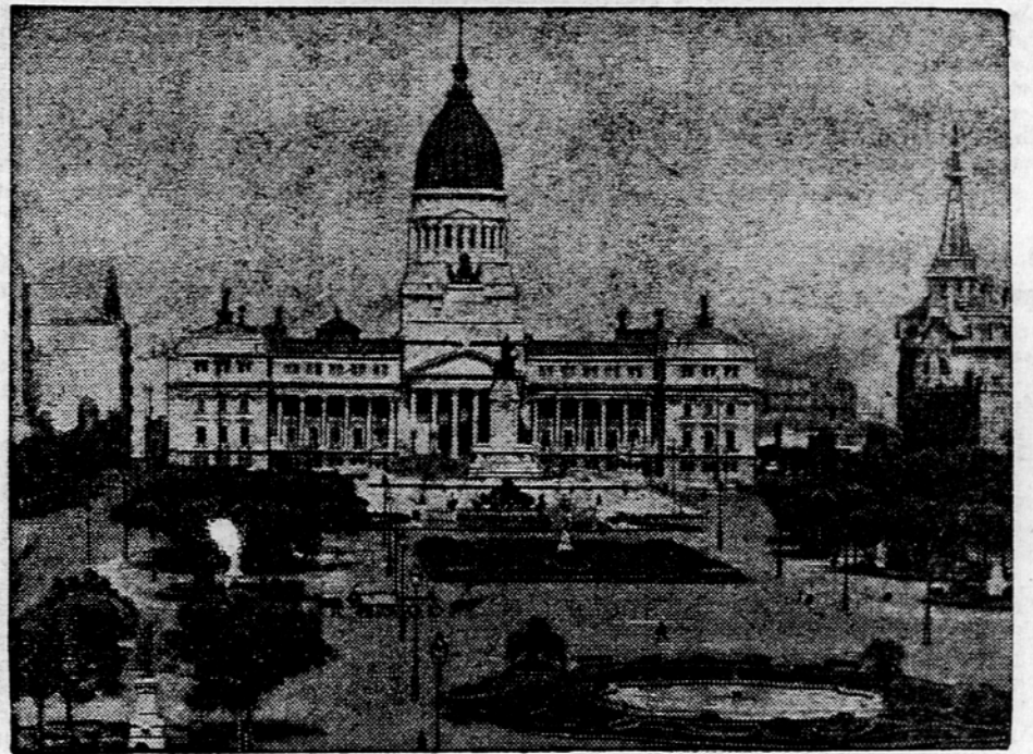
Plaza del Mayo v Buenos Airesu, veliki trg pred poslopjem argentinskega parlamenta, ki je bil zadnje dni prizorišče bojev med vladnimi četami in uporniki.

Časopis pa ne pove, če bo mogoče obdržati skupno fronto