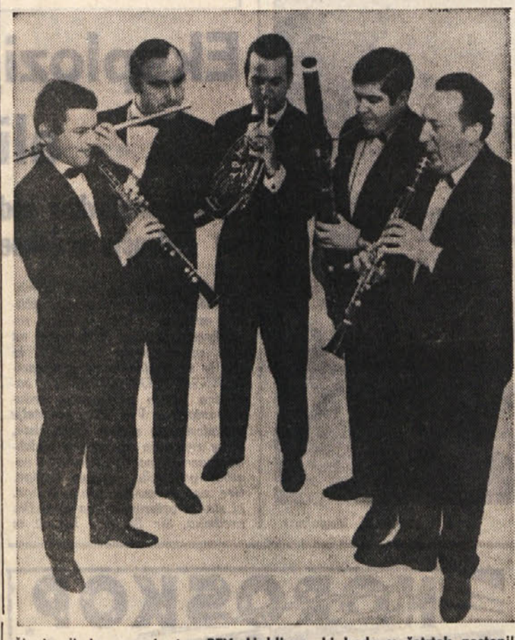
Člani pihalnega orkestra RTV Ljubljana, ki bodo v četrtek nastopili v mali dvorani Kulturnega doma v Trstu