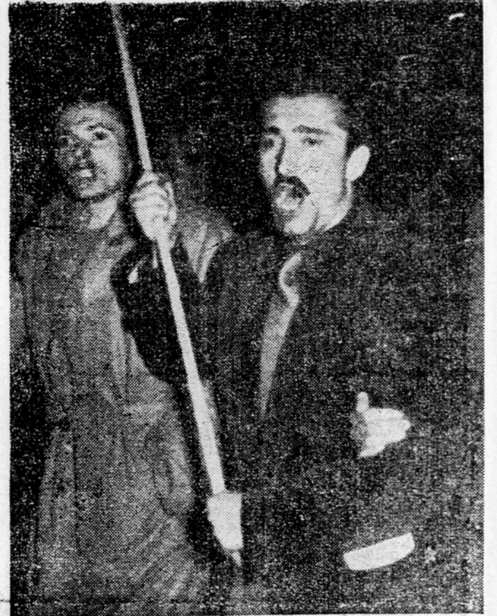
Nikoli...! (Z večerašnjih ljubljanskih demonstracij)

Koper, 8. okt. (Tanjug). Odločitev zahodnih sil o izročitvi cone »A« STO pod upravo Italije je razletela na veliko ogorčenje prebivalstva jugoslovanske cone. Takoj, ko so se pojavile prve neuradne vesti, da bo cona »A« STO prepuščena samovoljni rimski vojski in administraciji, so se začeli ljudje zbrati in ogorčeno protestirati. Nocoj so v Kopr, Piranu in Izoli prišle množice na trge, da bi izrazile svoje ogorčenje proti tej odločitvi vlad ZDA in Velike Britanije. Iz vrst demonstrantov so se slišali vzkliki: »Ne bomo dovolili, da fašistični škorenj stopa po naših krajih.« Življenje damo, Trsta ne damo! Množicij demonstrantov, ki so se nocoj spontano