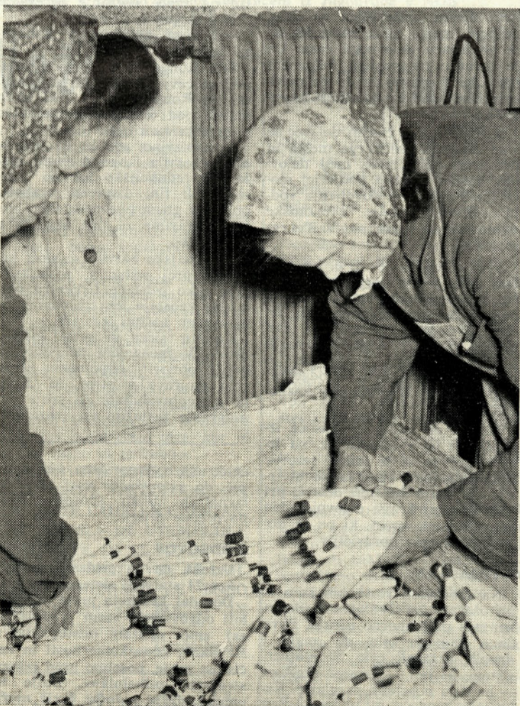
Proizvajavki urejata prejo v zaboljih

— utrditev, zatrditev — letnina, letni znesek ali obrok po dogovoru — prilagoditi, prirediti — nesmiseln — izdelek, proizvod — učinek, uspeh — ustanova, zavod — vlaganja — poseg, posredovanje — navdih — pristojni organ, oblast — ravnotežje — zmogljivost — nasledek, posledica — vejica — kakovost — količina — četrtletje — načelo — napoved — postopek — vprašanja, skupek vprašanj o čem — prednost — korenit, odločen — obnova, preureditev — zaloga, pridržek — poročilo — poročevavec — donosnost — uresničevanje, ostvaritev — ureditev, izboljšanje — sestava, ustroj — osebje — stanje, položaj — raven, norma