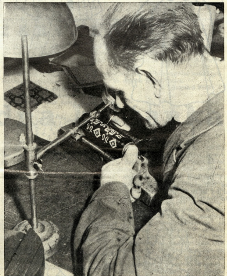
Delovno mesto: ročni graver, je natančno in zahtevno