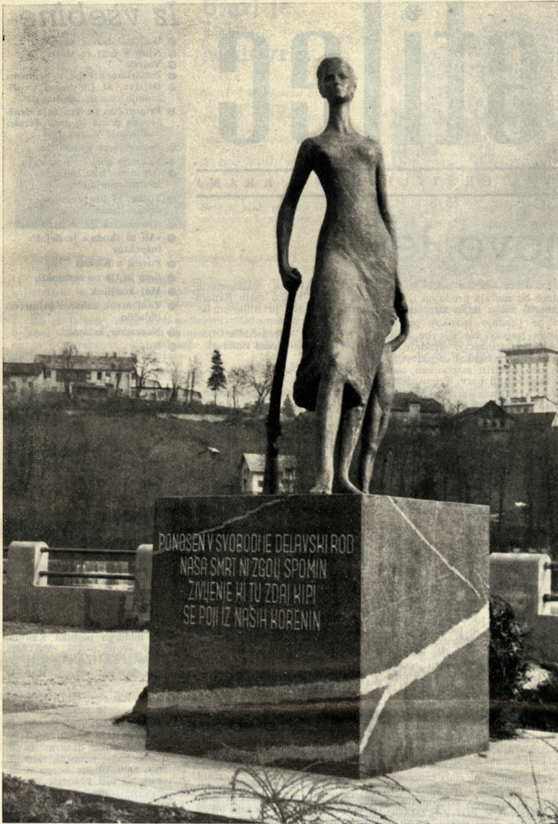
Spomenik v spomin padlim tekstilcem iz Jugobrone v NOB