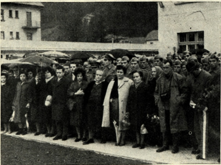
Clani kolektiva in gostje pri odkritju spomenika