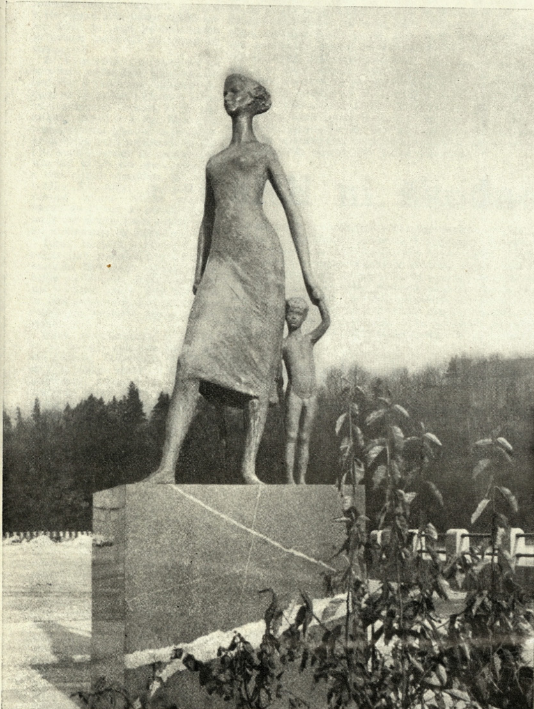
SPOMENIK PADLIM TEKSTILCEM