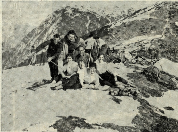
Tudi letos bodo smučarji prišli na svoj račun

REYONSKE TKANINE IN TKANINE IZ CELVOLE likamo skoraj suhe in z malo toplim likalnikom. Prehuda vročina tkanino zgrbanči, v hujšem primeru pa tudi stopi (priporočljiva temperatura 115 do 140 stopinj Celzija).