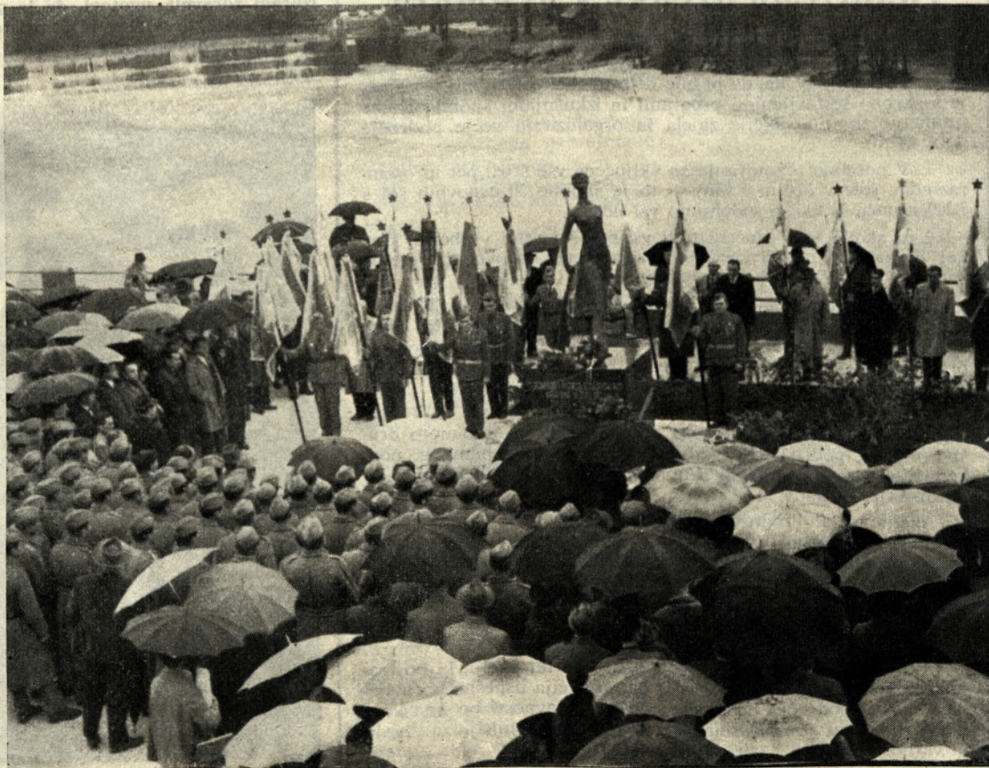
Res lep je bil pogled na svečanost 28. novembra v obratu I, ko je bil odkrit spomenik

ko služil tudi vsem tistim stvarim, ki doslej niso bile zajete (Dalje na 2. str.)