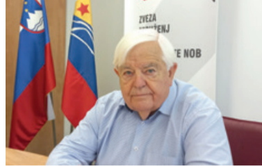
Jani Alič Spomeniki so odraz svojega časa