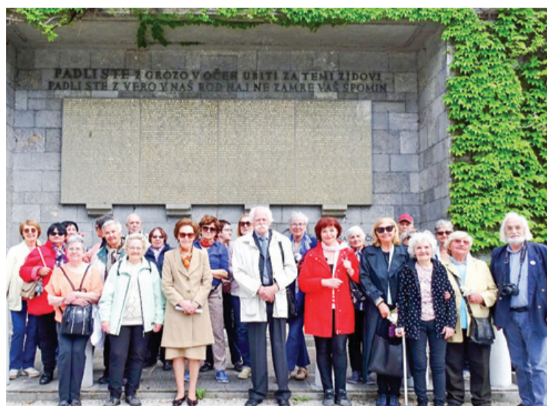
Pred spomenikom talcem v Mariboru

Nato smo se z avtobusom odpeljali na Petanjce in obiskali Vrt spominov in tovarštva, kjer od 7. maja leta 2021 raste tudi rumeni dren našega društva v znak prijateljstva in sodelovanja z Ustanovo dr. Šiftarjeva fundacija. Prepričali smo se, da rumeni dren lepo napreduje in da napis Društva Dobrnič »Vsem junaškim ženam« bogati širok spekter posajenih dreves in humanističnih izročil v spominskem vrtu. Sledila je slovesnost ob dnevu Ustanove Šiftarjeva fundacija / UŠF/, ki je bila letos z naslovom Naj mir nosi Tvoje ime posvečena ideji miru v svetu. Himno ustanove, to je Kajuhovo pesem Bosa pojdiva dekleta obsorej, so zapeli člani Moškega pevskega zbora Slava Klavora iz Maribora.