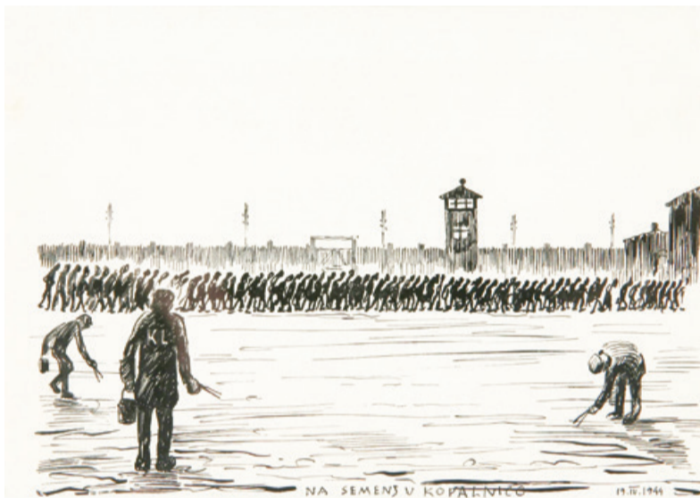
Vlasto Kopač, Na semenj v kopalnico , 1944.

Muzejska zbirka taboriščnih del je izjemna po številu ohranjenih likovnih del, vsebini, pripovednosti in likovni izvedbi. Poleg umetniške vrednosti imajo ta dela tudi veliko dokazno in dokumentarno vrednost. Vizualni zapisi taborišč so se sicer ohranili na nekaterih fotografijah, ki so nastale ali kot uradne fotografije takratne oblasti ali kot