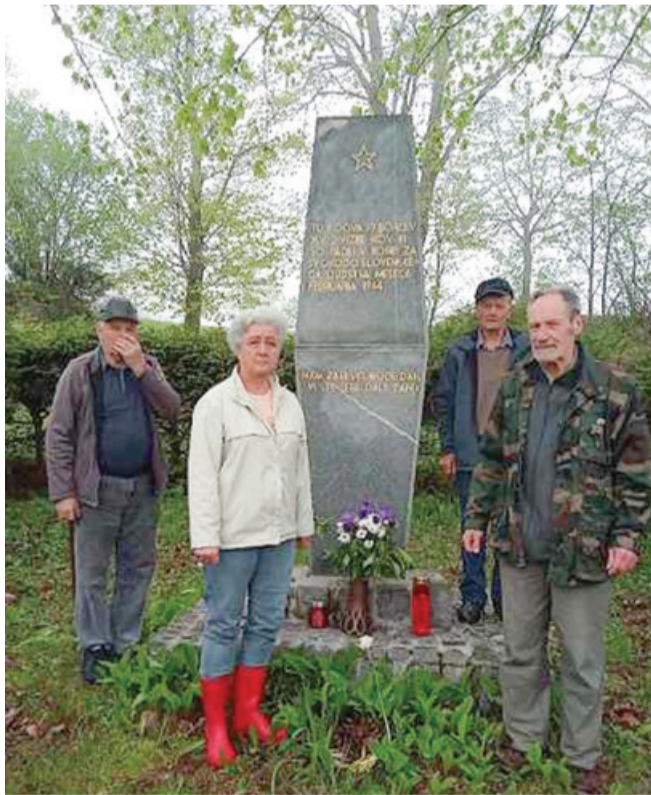
Obeležje na Visokem (Kozjak), postavljeno v spomin na prodor XIV. divizije na Koroško

Krajevna organizacija Zdrženja borcev za vrednote NOB v Dobrni že vrsto let skrbi za pomnike narodnoosvobodilnega boja. Vanj se je vključila velika večina Slovencev, saj so vedeli, da si okupator želi prisvojiti tudi ta del Evrope, ob tem pa hoče Slovence potujčiti in izbrisati kot narod. Predstavniki so ob dnevu zmage nad nacifašizmom obiskali partizanska obeležja in