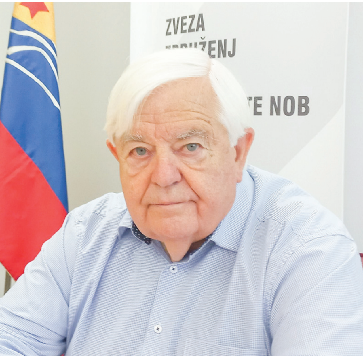
Milan Kučan na sedežu ZZB NOB Slovenije v Ljubljani