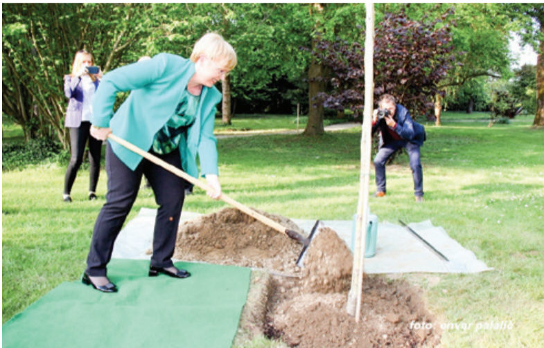
Predsednica Nataša Pirc Musar je na Petanjcih posadila spominski glog

Letošnji že 21. dan spomina in tovarištva, ki je bil 4. maja na Petanjcih in je največji in najpomembnejši letni dogodek Ustanove dr. Šiftarjeva fundacija v Vrto spominov in tovarištva, je bil posvečen miru in kulturi mira z večpomenskim naslovom Naj mir nosi tvoje ime. Dnevi spominov in tovarištva v vrto imajo že dolgo prav tako večpomenski skupni naslov Naši zakladi. In mir je velik zaklad, vrednota, želja in cilj, ki smo ga letos povezali z odnosom in delovanjem mladih v zapletenem svetu spletnih omrežij, kar je bila tudi tema letošnjega literarnega natečaja ustanove za učence in učence osnovnih šol in dijakinje in dijake srednjih šol v pomurski regiji.