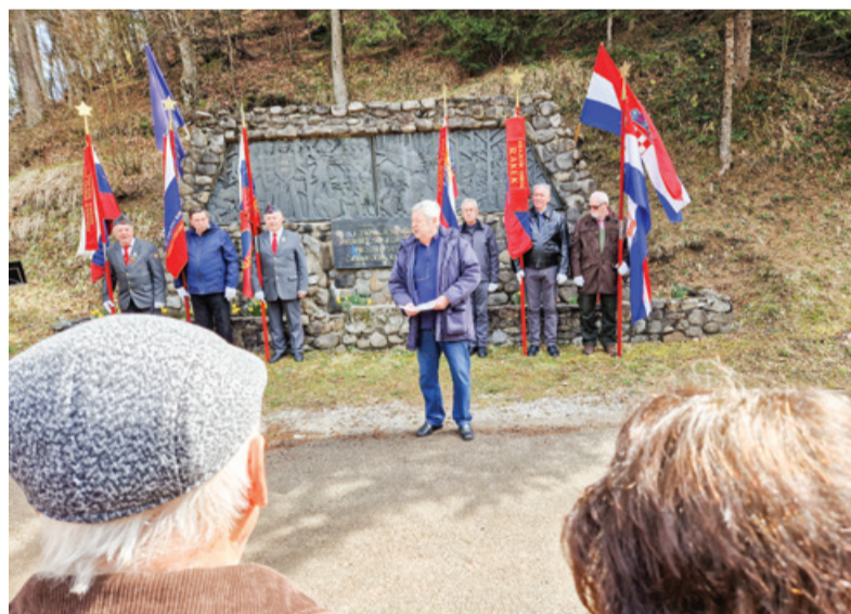
Letošnja slovesnost v Tatinski dragi

Ko so bili tovornjaki v tesnem useku, je zagrmelo in pesem se je spremenila v blazno kričanje. Italijani so bili ujeti v past brez možnosti bega. Ko je streljanje potihnilo, so