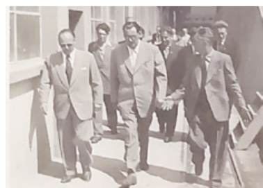
Franc Leskošek – Luka (v sredini)

22. junija 1941 je bilo ustanovljeno Glavno poveljstvo slovenskih partizanskih čet, pozneje Glavni štab NOV in POS. Prvi poveljnik je bil Franc Leskošek - Luka.