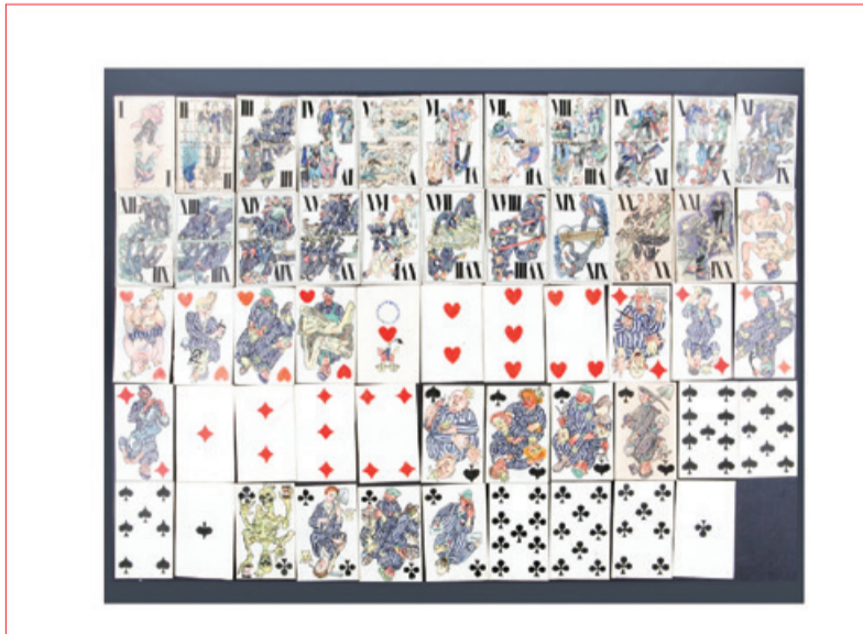
Boris Kobe, Taboriščni tarok, komplet kart , 1945

fotografije ob osvoboditvi taborišč. Kljub vsemu pa teh podob ni zelo veliko, sploh pa ne takih, ki bi odstirale dejanske življenjske razmere med delovanjem taborišč. Taboriščna likovna dela so zato izredno dragoceni dokumenti časa z (umetnostno)zgodovinskega, kul-