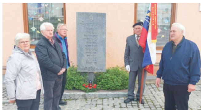
Spomenik na Zgornji Velki

Dan zmage, dan osvoboditve, dan zmage nad nacizmom in fašizmom so različna imena za dan, ki ga Evropa praznuje v spomin na zmago nad fašizmom in nacizmom. 9. maj 1945 je dan, ko se je v Evropi uradno končala druga svetovna vojna, morija, ki je tudi na našem koncu zahtevala ogromne žrtve. Končala se je vojna, ki je zahtevala več žrtev med civilisti kakor med vojniki. V vojni, ki je trajala dolgih šest let, moriji, ki je zahtevala 60