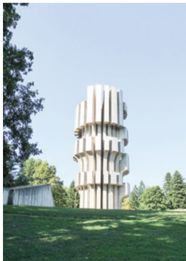
Spomenik na Kozari

obkolitev planine Kozare. Med napadom so se ustaši in Nemci znesli nad prebivalstvom, okoli 70.000 ljudi je bilo ubitih ali odpeljanih v ustaška taborišča.