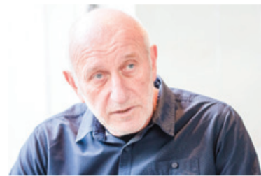
Dr. Dušan Plut, član osamosvojitvenega Predsedstva RS

Junjske dneve zadnjih nekaj desetletij upravičeno ključno zaznamuje praznovanje dneva državnosti Republike Slovenije (25. junij 1991) v spomin na sklepno politično dejanje uresničitve nacionalne suverenosti. Izjemen uspeh plebiscita 23. decembra 1990 z več kot 95 odstotki glasov volilnih upravičencev za samostojno Slovenijo je dejansko temeljni nacionalni gradnik zadnje faze osamosvojitvenih dejanj, ki se jih danes upravičeno lahko z velikim ponosom spominjamo.