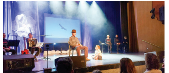
Besedilo je podprla projekcija fotografij.

Obiskovalci, ki so dodobra napolnili dvorano Doma II. slovenskega tabora v Žalcu, so bili navdušeni, da smo se tako lepo poklonili pesniku. Kajuh je bil v prvi vrsti človek, ki mu je bilo mar za sočloveka, za domovino, pravico, ljubezen. Kot je dejal pesnik Oton Župančič, ki ga je Kajuh obiskal pred odhodom v partizane: »Pozdravljen, Kajuh, črni la-