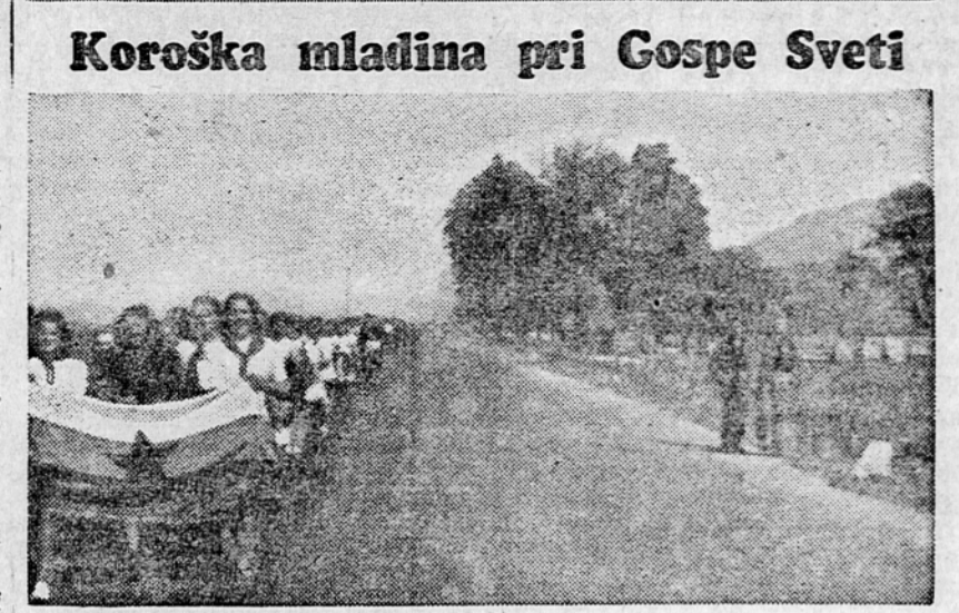
Koroška mladina pri Gospe Sveti. Pri Gospe Sveti se je zbrala 16. septembra mladina celovškega in be-ljaškega okraja in je izglasovala resolucije, naslovljene svetovnemu protifašističnemu mladinskemu komiteju, maršalu Titu in Glavnemu odboru USAOJ-a. Prisotni so bili tudi zastopniki avstrijske mladine. Mladina je glasno manifestirala za demokratično federativno Jugoslavijo.