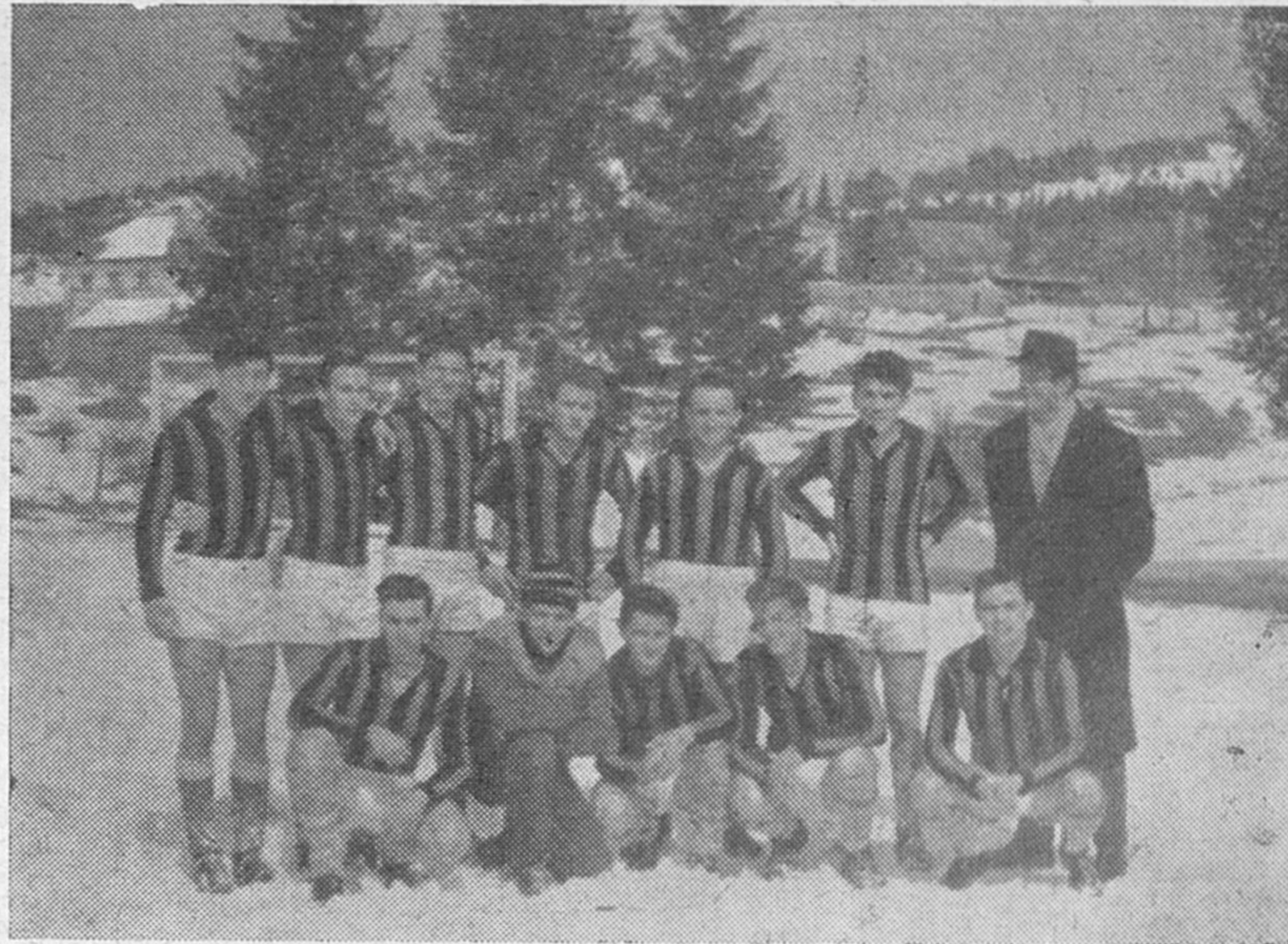
V pretekli sezoni je začelo moštvo NK Rakek s tekmami že v času, ko je bilo igrišče še pokrito s snegom.

Imamo možnosti, da bi ustanovili košarkarsko, odbojgarsko, namiznoteniško sekcijo. Toda ne moremo, ker ni zanimanja pri mladini. V dvorani stoje najrazličnejša orodja in iz dneva v dan pričakujejo mlade ljudi, da bi na njih preizkušali svojo moč in spretnost.