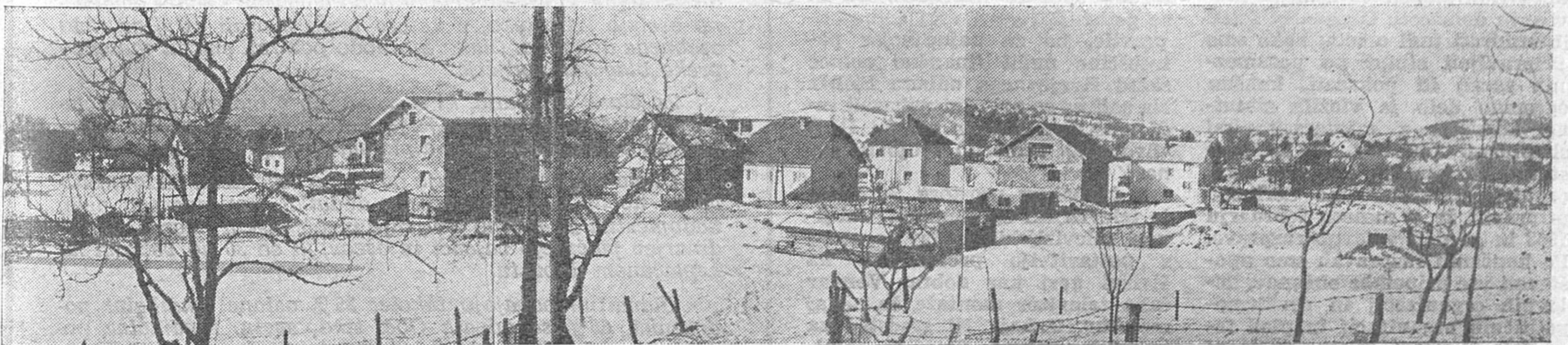
NA VIDMU V CERKNICI JE INDIVIDUALNA GRADNJA V POLNEM RAZMAHU. NOVI URBANISTIČNI NAČRT DOLOČA ZIDANJE POSAMEZNIKOM PRAV NA TEM PODROČJU.

Sedaj pripravljajo ureditvene načrte za Loško dolino in Rakek. MaD