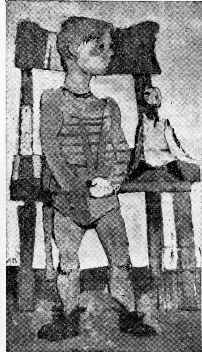
Marij Pregelj: Otrok, olje, 1953