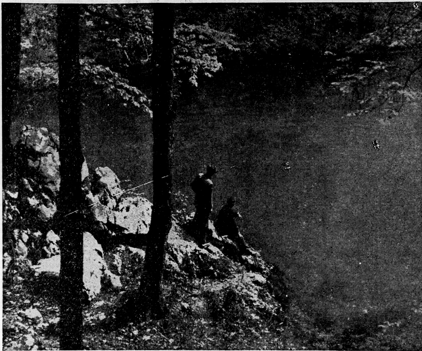
Divje Jezero pri Idriji

Na pobudo slovenskih tekstilnih podjetij je bilo te dni v Mariboru kot mestu z dolgoletno tradicijo tekstilne industrije ustanovljeno Združenje tekstilnih proizvajalcev FLRJ. Naloga Združenja je, da na podlagi medsebojnih posvetovanj sprejema sklepe, stavlja predloge in ukrepa o vsem, kar je potrebno za reševanje vprašanj, ki se nanašajo na tekstilno industrijo. Članstvo v Združenju je prostovoljno, vendar je po razpravi na ustanovnem sestanku v Mariboru mogoče trditi, da se bodo članstva v Združenju vsa tekstilna podjetja Jugoslavije.