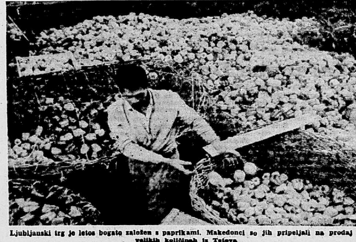
Ljubljanski trg je letos bogato založen s paprikami. Makedonci so jih pripeljali na prodaj v velikih količinah iz Teševa

Sarajevo, 13. sept. Na prostoru med Sarajevom in Mostarjem bodo do konca leta zaključili bodočo normalnotirno progo Sarajevo—Ploče, ki bo dolga 185 km, del proge od Mostarja do Metkovića pa so že zaključili.