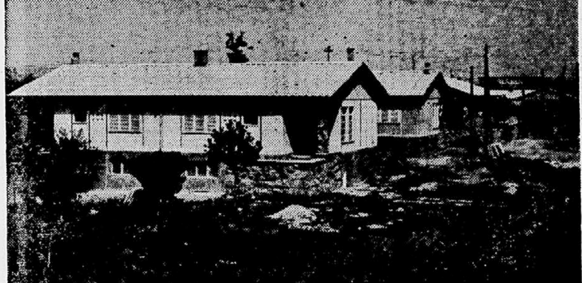
Stanovanjsko naselje montažnih hiš v Zagrebu, ki jih izdeluje tovarna »Jugomont«

580 novih proizvodov Oznaka »nov proizvod«, predvsem pri predmetih široke potrošnje, je na tem sejmu dokaj pogosta.