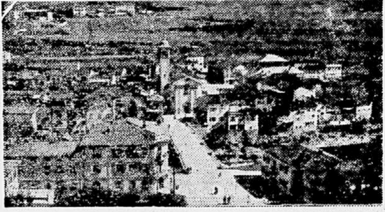
Pogled na Kanal, enega izmed najbolj slikovitih krajev ob Soči