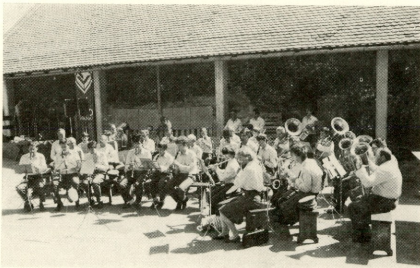
Srečanje je popestril tudi koncert godbe na pihala z Vrhnike