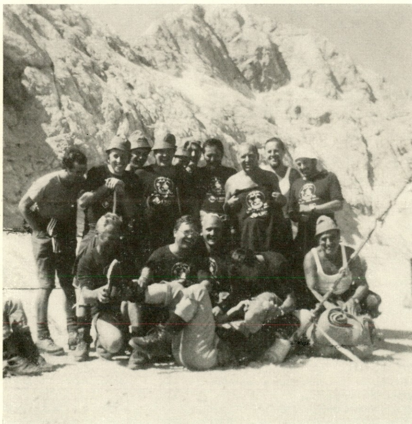
Udeleženci pohoda na skupinskem posnetku

Vrzdeneč in naprej proti Suhemu dolu, kjer je bila naša prva postaja. Posredovati je moral tudi amaterski »padar«, da je povil prve žulje. Po malici smo nadaljevali preko Lučen in Vinharjev v Poljansko dolino skozi Poljane do Delnic, kjer nas je zaustavila noč. Po večerji, ki jo je pripravil naš inten-