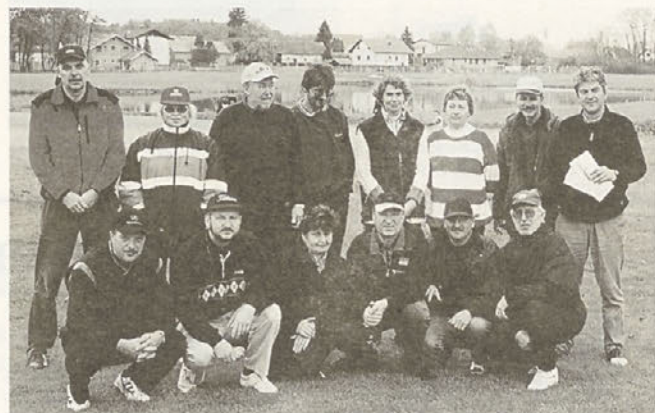
Udeleženci prvega občinskega tekmovanja v golfu

Sekretar Športne zveze Hajdina Sandi Mertelj