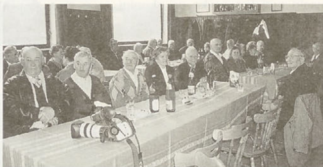
Letošnji najstarejši udeleženeec prihaja iz Zg. Hajdine. Ima 88 let, se korajžno drži, je dobre volje, dokaj neodvisen in trdoživ. Kdo je to?