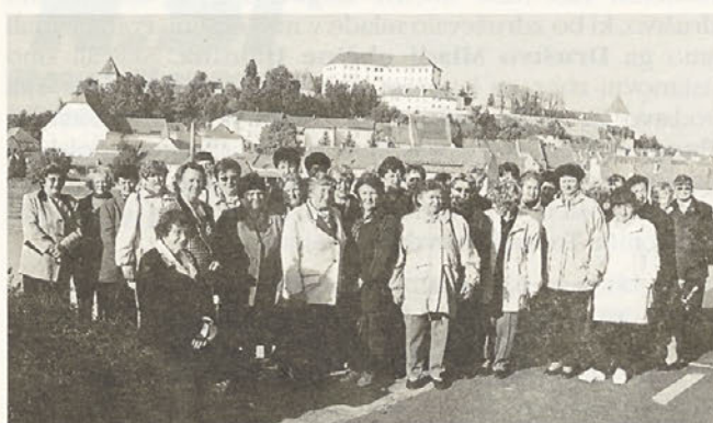
Hajdinčanke na zgodovinski ekskurziji