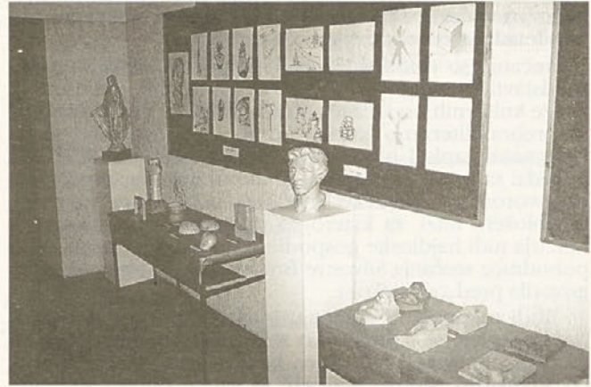
S. B.

Pričujoča razstava je po izjavi likovne pedagoginje na OŠ Hajdina, Romane Kiseljak, primerno dopolnilo pri urah likovne vzgoje, ker učencem pomaga pri razkrivanju določenih kiparskih in rezbarskih pojmov, ki jih je potrebno poznati za uspešen začetek dela.