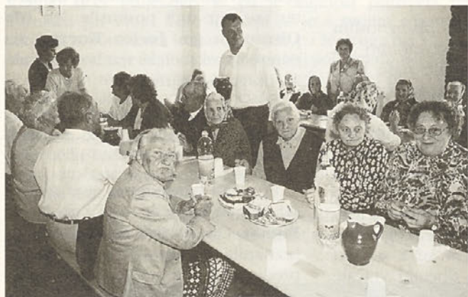
Ob srečanju ostarelih

Karitas je prostovoljna cerkvena organizacija, ki nima nobenega rednega vira sredstev, deluje izključno s pomočjo prostovoljnih prispevkov. V letu 1997 smo v gospodarskem posloplju na župnijskem dvorišču preuredili