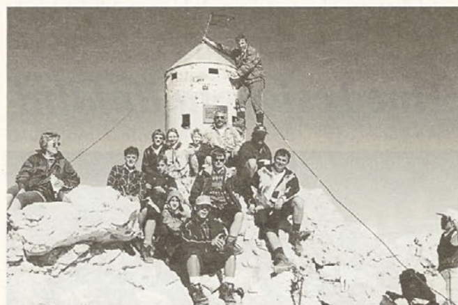
Bili smo na Triglavu.