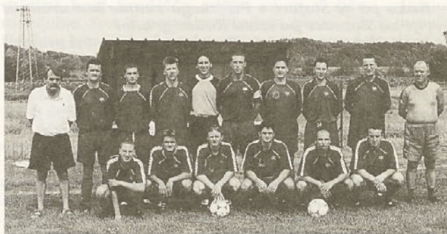
Moštvo, za katero navijajo Slovenjevasčani.

Na osrednji prireditvi ob visokem jubileju so najprej podelili pokale najboljšim ekipam v članski in veteranski