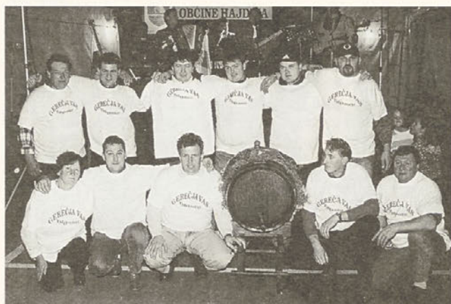
Zmagovalci pri tekmovanju v vlečenju vrvi, letos ekipa iz Gerečje vasi.