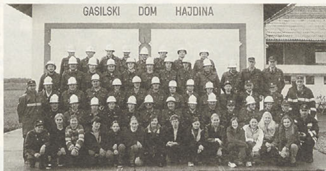
Tako so 5. 11. 2000 izgledali uniformirani in ostali člani PGD Hajdina.