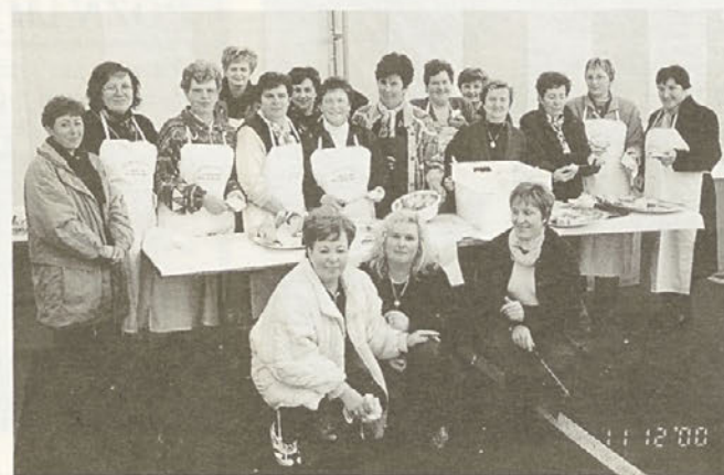
Gospodinje iz Škorbe, ki so v šotoru skrbele za to, da nismo bili lačni.