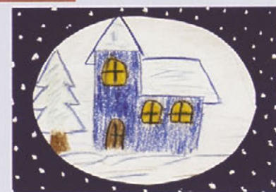
Z razstave JEDI IN PIJAČE SKOZI ČAS MOTIVI VOŠČILNIC UČENCEV OŠ HAJDINA