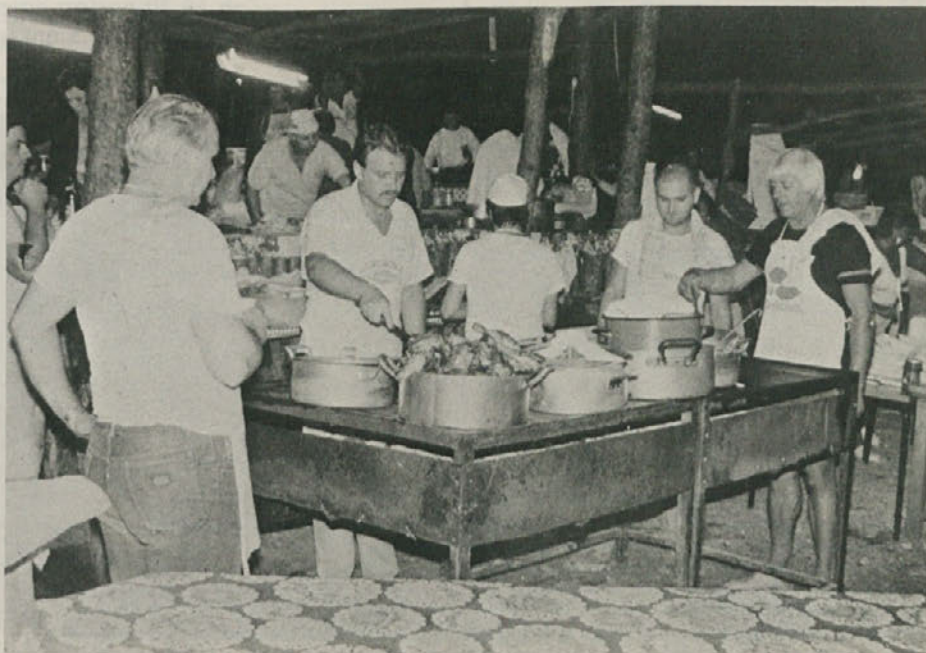
V borovem gozdiču pri Mačkoljah so prejšnji teden priredili lepo uspelo šagro PD Primorsko.

Nekaj podobnega bi pričakovali tudi doma pri socialistih. Ne moremo si predstavljati, da stranka s sestavo, s preteklostjo, z zgodovino, z izvorom, kakršne beleži socialistična stranka, nenadoma pozablja na slovensko problematiko do te stopnje, ali, morda bolje povedano, da do tako nizke točke popušča, ko gre za slovensko manjšino. Od take stranke, ki ima z nami enako rojstvo in podoben razvoj, pričakujemo nekaj več in si ne moremo predstavljati da se naenkrat več ne zmeni za svoj del drugega jezika, in to v dobi, ko vprašanje narodnostne identitete državljana