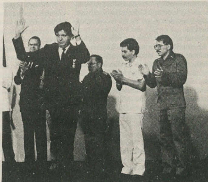
Alan García in Daniel Ortega. Različne poti, isti cilj: demokracija.

Odgovor dobim tudi ko se sprehajam po čudoviti knjigarni, ki je prav v središču lepo urejenega festivala. Knjigarna je res bogato založena in večina razstavljenih knjig (nekaj deset tisoč jih je) se po vsebini popolnoma ujema s sporočilom, ki ga festival želi posredovati. Bogat izbor knjig zadeva namreč narode in države Srednje in Južne Amerike, zadeva njihovo davno in novejšo zgodovino, pripoveduje o njihovi kulturni, o literaturi in poeziji, pričajo o vztrajnem boju za samoohranjanje,