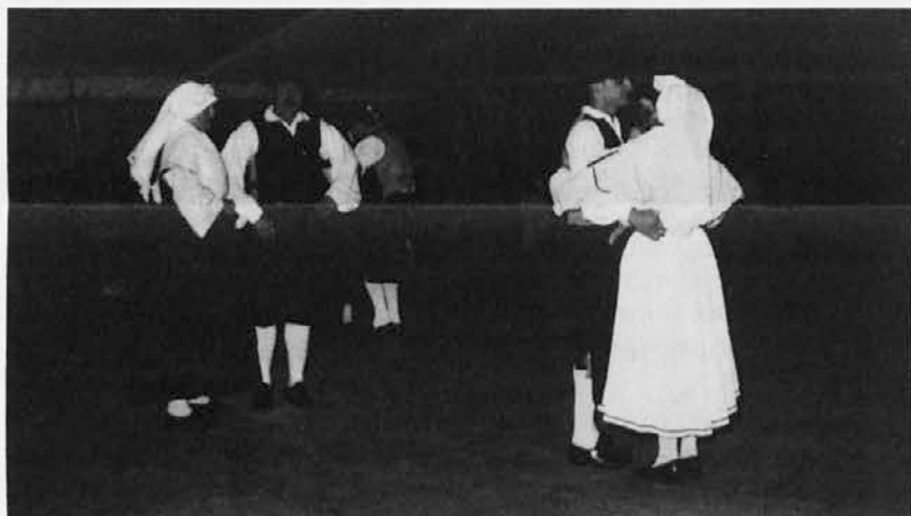
Folklorna skupnija Stu ledi je med nastopom v Favergesu prikazala tudi istrske plesne

reditev v Favergesu osredotočena zlasti na glasbi, saj se ji pozna, da so njeni ustanovitelji glasbeniki. Zamisel za tovrstno srečanje se je namreč pred dvema letoma porodila članom tamkajšnje glasbene skupine La Kinkerne, ki so z žalostjo opažali zamiranje živih izvedb pristne ljudske glasbe, saj so jo zanemarjale celo folklorne skupine, ki so še prepogostokrat nastopale na posneto glasbo. Obe nem so hoteli poudariti tudi njeno povezovalno vlogo, saj so nekateri motivi prisotni na obeh straneh najvišje evropske verige, in to od zahoda do vzhoda. Njeni vplivi se poleg tega kažejo tudi v avtorski glasbi, ki tako ali drugače raste iz njenih temeljev. Zato so bile na festivalu v Favergesu prisotne raznovrstne skupine, predvsem seveda glasbene. Še največ prostora je plesu posvetilo ravno Stu ledi, ki je v dveh nastopih predstavilo ljudsko izročilo z vzhodnega roba, kjer se alp-