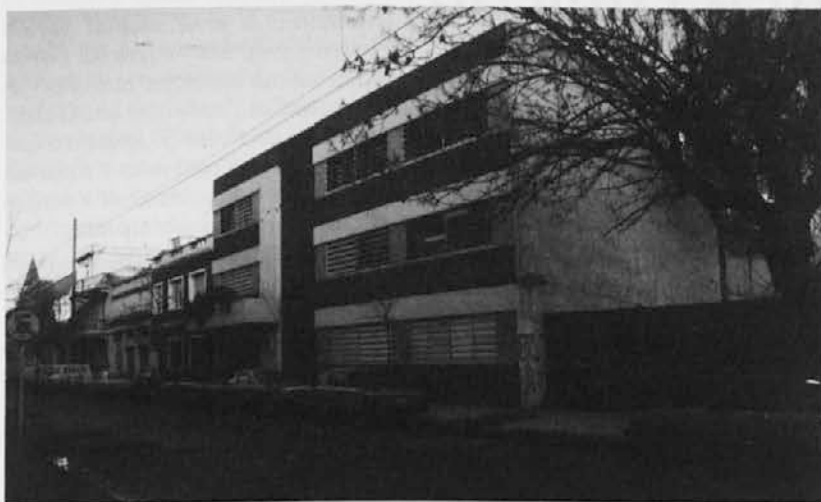
Slovenska hiša v ulici R. Falcón v Buenos Airesu, kjer je sedež osrednjih organizacij slovenske politične emigracije

Morda je vnašanje emigrantske kulture v slovensko narodno zavest še najlažje delo. Težje je to na področju politične misli in ideologije. Prav tu pa je SKA spet paradigmatična, kajti