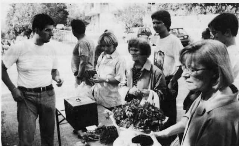
V Gročani je bil konec prejšnjega tedna dobro obiskan sejem domačih kmetijskih pridelkov, ki ga prireja domače društvo Krasno polje. Udeležba je bila številna tako čez dan kot tudi ob večerih, ko so udeleženci napolnili plesišče. Zelo lepo je uspela tudi odprta meja.

Predgovor je napisal zunanji minister Lojze Peterle