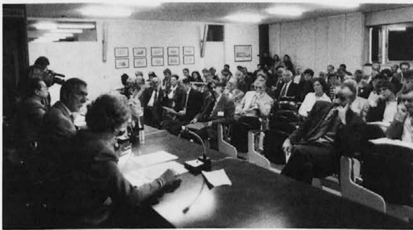
Udeleženci mednarodnega posveta na tržaški univerzi