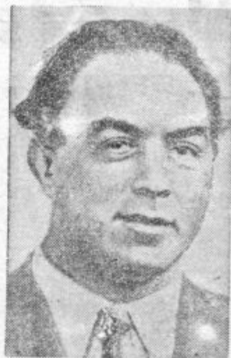
Predsednik katalonske vlade Juan Casanovas

Predsednik republike Cardenas je dal razdeliti orožje med komunistične strokovne organizacije in »rdeče srajce«, to je komunistično tako zvano »rdečo kmetijsko mladino«, ki jo je organiziral kmetijski minister Garrido Canabal. Radi