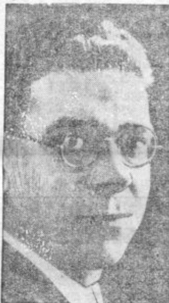
Španski uporniški general Mola, čegar čete prodirajo proti Madridu in so po zadnjih poročilih oddaljene le še 25 kilometrov od prestolice

bo te dni podpisana nova pogodba o sporazumu. Nahas paša se je s člani egiptske delegacije že vkrcal za pot v Marseille, odkoder pojde vsa delegacija v Pariz in dalje v London, kjer bo nova pogodba podpisana.