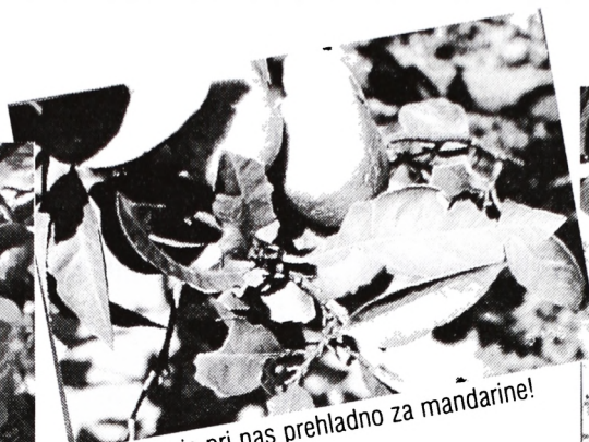
Ni res, da je pri nas prehladno za mandarine!