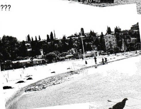
Plažo tudi čistijo...