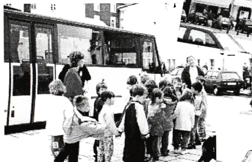
Malčki na sprehodu