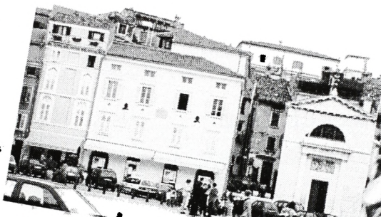
Običajen piranski vrvež