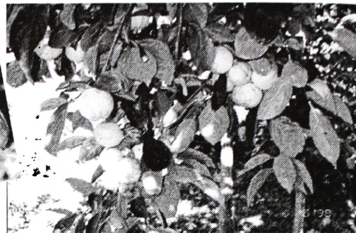
Kar šibi se od teže zlatih jabolk!