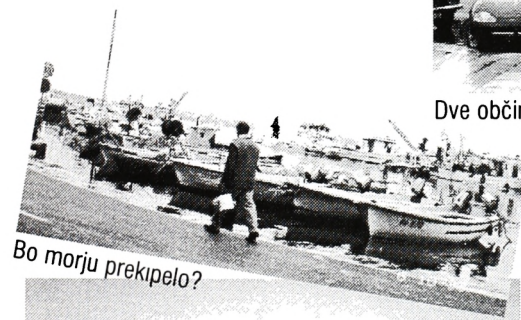
Bo morju preklopelo?