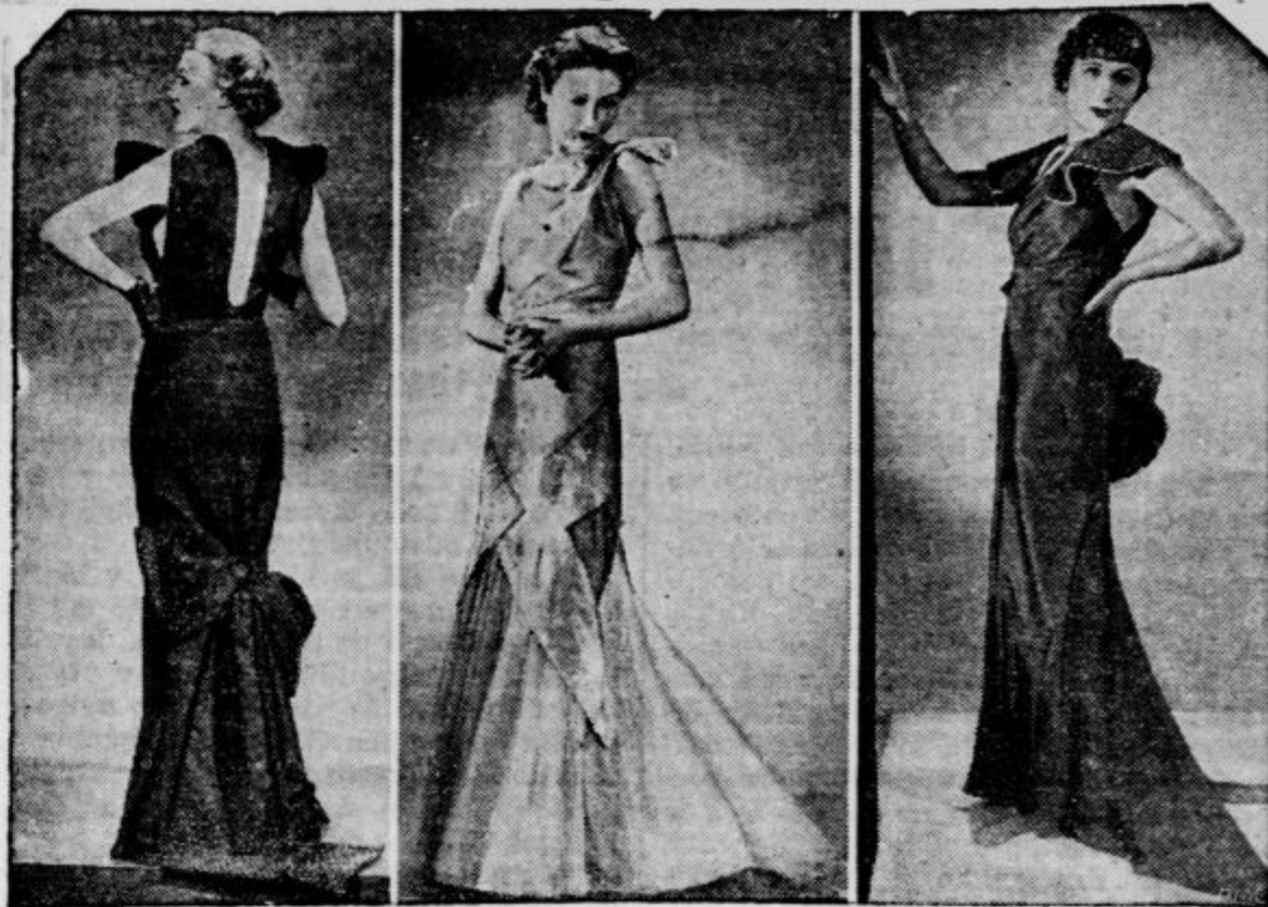
nam kaže ta slika tri okusne najnovejše ženske modno kreacije