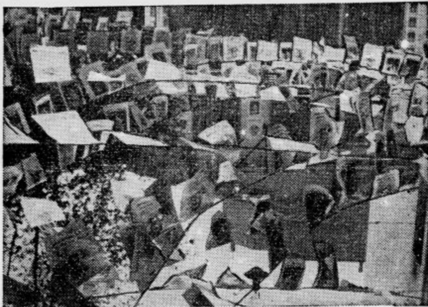
Takole so bile atenske ulice nalepljene s plakati za nedeljske volitve na Grškem