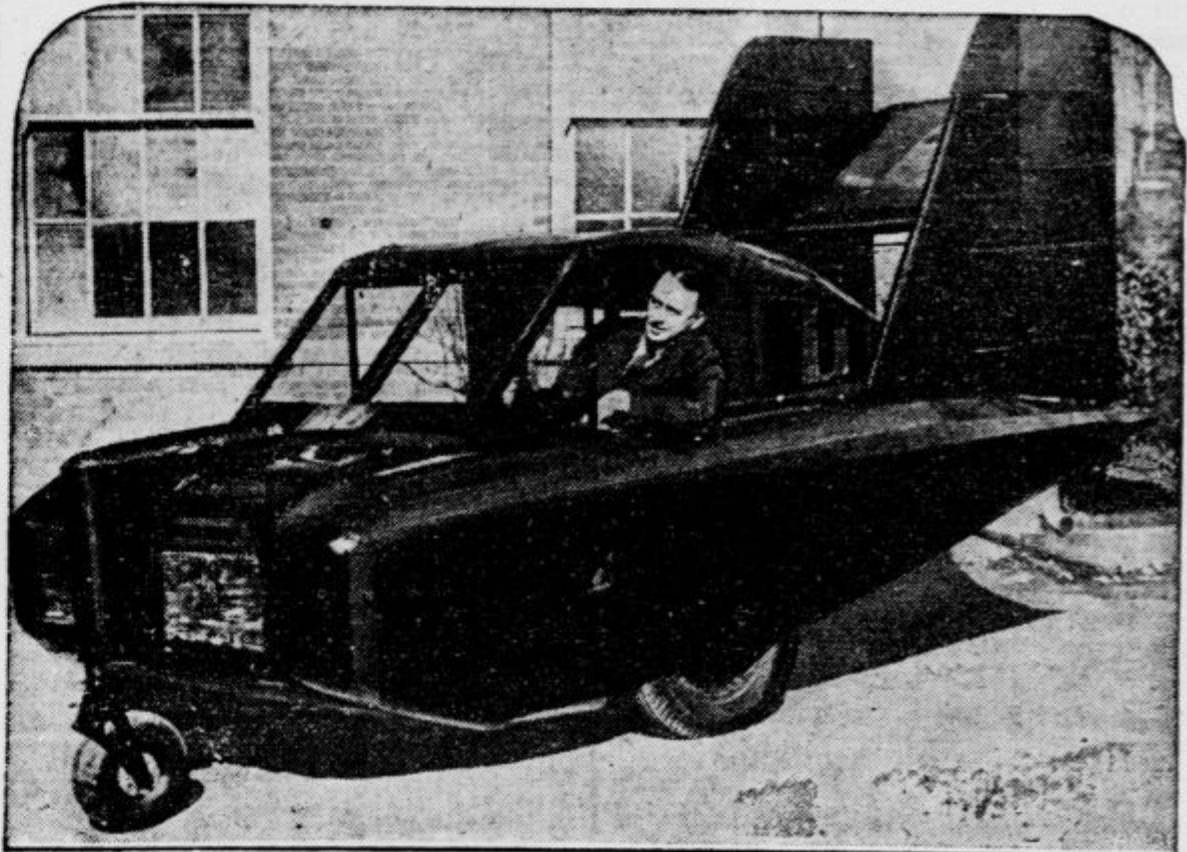
Najnovejša iznajdba v tehnični stroki je avtomobil, ki se da v kratkem času spreminiti v aeroplan s krili ob strani