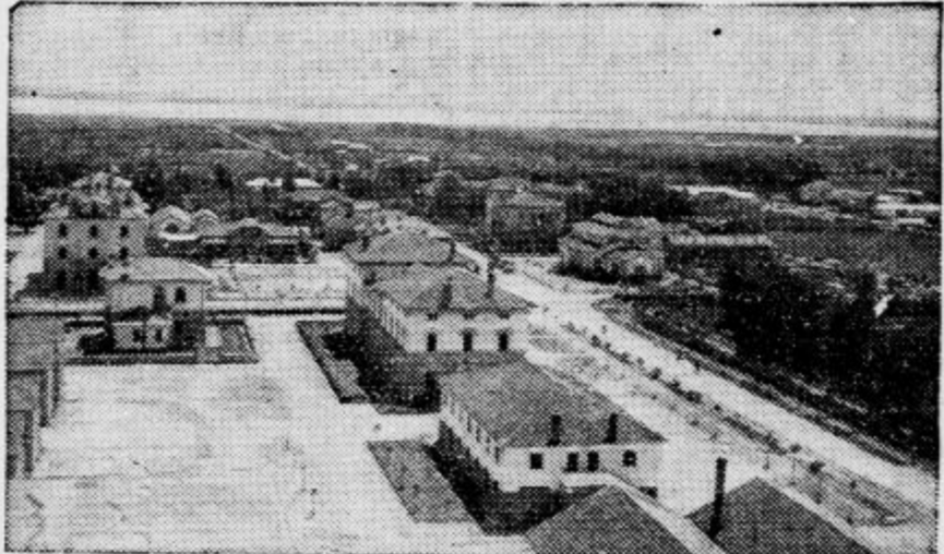
Na Sardiniji so zgradili novo mesto, ki je dobilo ime po rimskem ministrskem predsedniku. Mestece je prav čedno in šteje zdaj 8000 prebivalcev