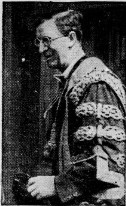
Predsednik Irske vlade de Valera s nasmeškom, kakor ga doslej še ni ujeta fotografska plošča