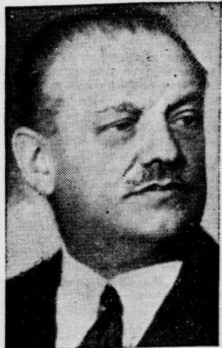
Pokojni minister Marcombes