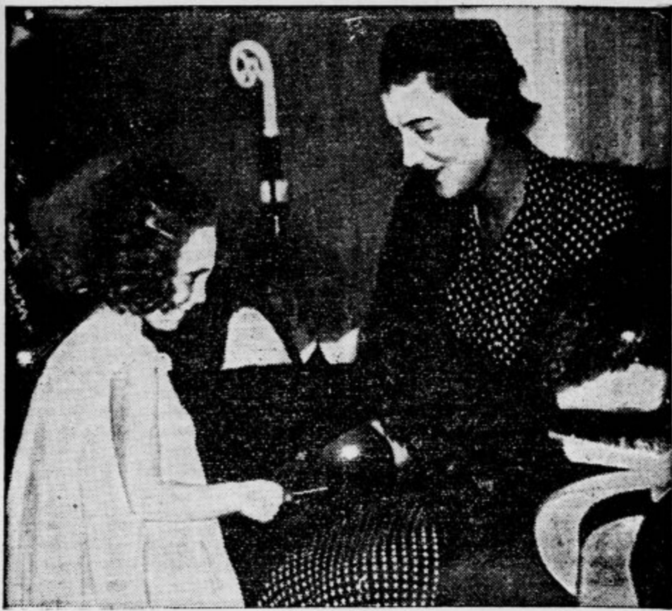
Se je te dni prvič pojavila v neki londonski šoli in se pogovarjala z učenkami