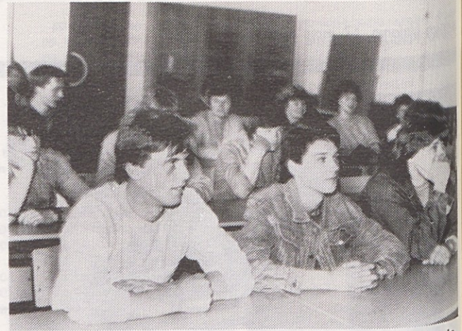
Po dodatno, novo znanje za delo ne bo treba več drugam. Tu je sodobna učilnica, učna sredstva, strokovnjaki in volja za učenje.