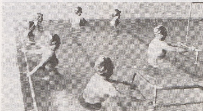
Razgibavanje v bazenu je le ena izmed koristnih oblik preventivno-rekreativnega zdravljenja delavcev v Topolišči

Od organizirane zdravstveno preventivne rekreacije pričakujejo krepitev psihofizičnih sposobnosti delavcev, njihovo osveščanje in pripravljenost, da podobne oblike rekreacije negujejo tudi v prostem času in s tem izboljšujejo svoje zdravstveno počutje. To vse bo prispevalo k preprečevanju poškodb, invalidnosti ter ohranjanju vitalnosti do upokojitve in nenazadnje k zmanjšanju bolniških izostankov. O vtisih udeležencev zdravstveno preventivne rekreacije bomo pisali v prihodnjem Informatorju. Dušanka Založnik