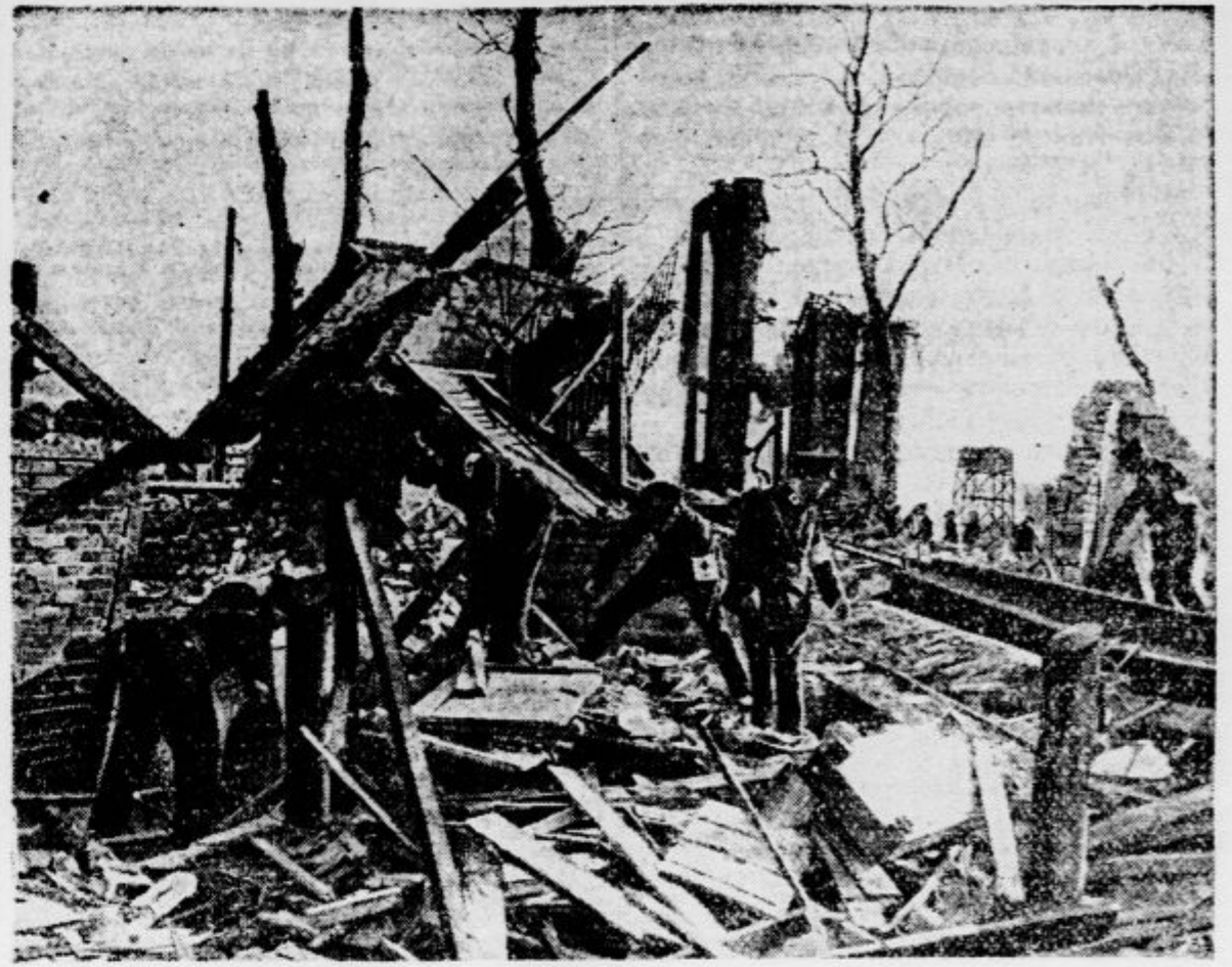
Po eksploziji gazometra v Neunkirchnu iščejo pod razvalinami še vedno mrličev, ki so, žal, še zasuti