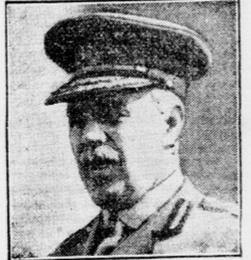
Maršal Robertson bilviš čef angleškega glavnega stana na francoskem bojišču in poznejši poveljnik angleških čet v zasedenem Poruhrju, je umrl te dni v Londonu