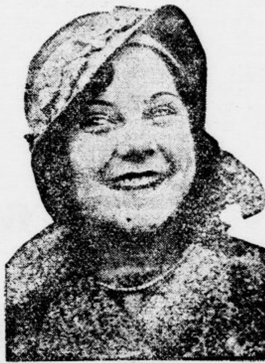
Sonja Henie potem, ko je te dni sedmici zmagala v tekmah za svetovno prvenstvo na ledu