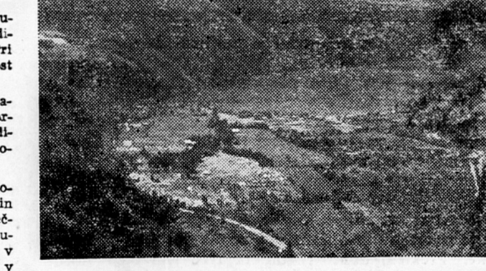
Pokrajina ob Millstättskem jezeru s stalnim taboriščem »Rdečih sokolov«

previdni in se boje vsake zunanje enotnosti, vsega, kar vidiš po uniformi in drilu. Pri tem poudarjajo, da je enotnost duha najvažnejša. Po izpolnjenem 16. letu starosti prestopi mladinec v organizacijo socialistične mladine, kjer ostane do svoje polnoletnosti. Najmanjša organizacijska enota Rdečih sokolov je horda in šteje 10 do 12 a največ 15 dečkov ali deklic. Več hord skupaj tvori grupo, več grup v istem kraju pa se združuje v krajevno grupo. Vse grupe in krajevne grupe ene pokrajine tvorijo pokrajinsko grupo in te tvorijo potem »Zvezo Rdečih sokolov Avstrije«. V tritedenskem skupnem življenju z Rdečimi sokoli smo slovenski taborniki šele spoznali, koliko lažje stališče imamo mi, ker uživamo vso podporo ljudske oblasti. Vsega tega oni ne poznajo. Ni samo to, da ne uživajo podpore svoje države, temveč jih ta pri njihovem delu celo ovira. Razen tega imajo še nebroj drugih ovir, ker žive pač v kapitalističnem družbenem redu. Tako imajo n. pr. težave s tabornimi prostori, ker jim privatni lastniki nočejo dati v najem zemljišče ta je bilo