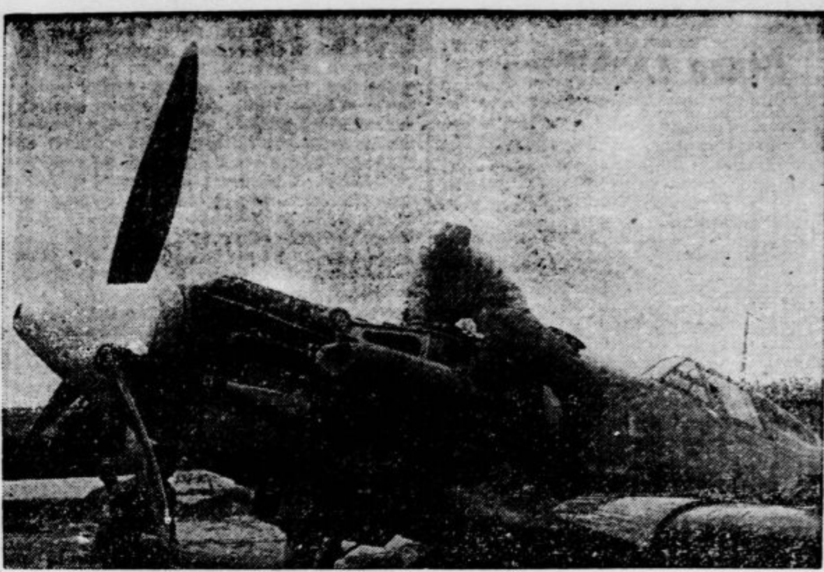
Nostri caccia, di ritorno da azioni di guerra, vengono revisionati per essere prontamente impiegati in nuove azioni. — Italijanski lovec, ki so se vrnili z vojnih akcij, se pregledujejo, da bi bili takoj uporabljeni za nove akcije

— Zaldjuček damsko-frizerskega vaje-niškega tečaja. Odešek za obrtništvo Združenja industrijev in obrtnikov Ljubljanske pokrajine je priredil s podporo Visoke komisarijate v svoji šoli v Selenburgovi ulici tromesečni tečaj za vajeke frizerske stroke, ki je bil zaključen v nedeljo 17. januarja z nagradnim friziranjem. Te-