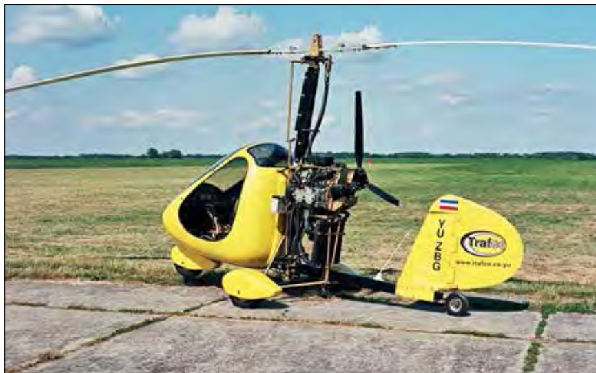
Žirokopter letalstva Farrag

Ideja o ustanovitvi stanovskega združenja lastnikov letal in pilotov AOPA v Sloveniji je bila navdahnjena prav z ustanovitvijo ameriške AOPE. Takoj po osamosvojitvi Slovenije so se začele