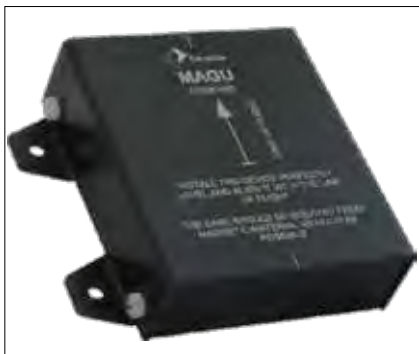
Magnetni kompas podjetja Kanardia

AOPA ZDA je nastala leta 1939, sedež ima v Fredericku, v državi Maryland v Združenih državah Amerike. Je neprofitna organizacija, ki nastopa v korist generalnega letalstva. Njeno članstvo v glavnem sestavljajo piloti generalnega letalstva ZDA, po trenutni oceni naj bi bilo članov okrog 414 000. Z drugimi sorodnimi organizacijami je AOPA ZDA povezana kot članica Sveta Mednarodnega združenja lastnikov letal in pilotov (IAOPA-International Council of Aircraft Owner and Pilot Association).