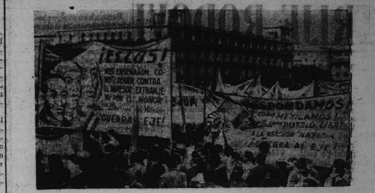
Več tisoč Mehikancev je vpriporilo demonstracijo proti Nemčiji, Italiji in Japonski na velikem trgu pred predsedniško palačo.

po 56 ur na teden, oni v ladje-delnicah so po 52 ur na teden na delu in oni, ki gradijo parne lokomotive delajo po 53 ur na teden."