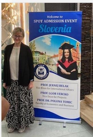
Dekanica Ekonomsko-poslovne fakultete UM, na obisku agencije Europe Study Centre (P) Ltd., v Indiji